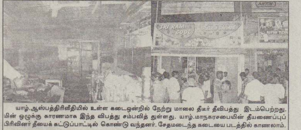
யாழ்ப்பாணம் ஆஸ்பத்திரியில் உள்ள கடை ஒன்றில் நேற்று மாலை தீயிடித்து இடம்பெற்றது. மின் ஒழுக்கு காரணமாக இந்த விபத்து சம்பவித்துள்ளது. யாழ்ப்பாணம் நகரசபையின் தீயணைப்புப் பிரிவினர் தீயைக் கட்டுப்பாட்டில் கொண்டுவந்தனர். சேதமடைந்த கடையை படத்தில் காணலாம்.

முனிதனம்) என்னிடம் கொடுத்தீர்கள். அது என் ஆய்வில் உள்ளது" என்று கூறி அவருக்குப் பேசுவதற்கு அனுமதி மறுத்தார். இந்தப் பிரச்சினையை இன்றே (அதாவது நேற்று) விவாதத்துக்கு எடுக்கவேண்டும் என்று அ.தி.மு.க. உறுப்பினர்கள் அனைவரும் அவையில் எழுந்து நின்று வலியுறுத்தினார்கள். ஆனால் சபாநாயகர் அதற்கு அனுமதி மறுத்துவிட்டார். இதனைக் கண்டித்து அ.தி.மு.க. உறுப்பினர்கள் அனைவரும் சட்டசபையில் இருந்து வெளிநடப்புச் செய்தார்கள். அவர்களைத் தொடர்ந்து ம.தி.மு.க. உறுப்பினர்களும் வெளிநடப்பில் ஈடுபட்டனர். ஆனால் அ.தி.மு.க. உறுப்பினர் எஸ்.வி.சேகர் மட்டும் இந்த வெளிநடப்பில் கலந்துகொள்ளவில்லை.