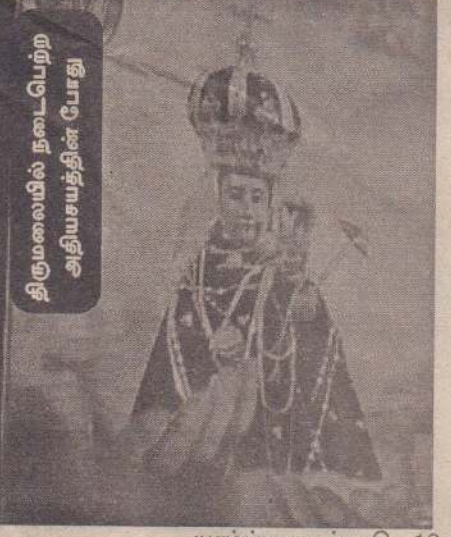
யாழ்ப்பாணம், டிசெ.16 மாதாவின் திருவுருவப்படங்களிலிருந்து இரு கைகளும் வெளியே வந்து ஆசீர்வாதம் வழங்குவது போன்ற அருட்காட்சி நேற்று பருத்தித்துறை தும்பளையிலும் திருகோணமலையிலும் பலரையும் பரவச்செடுத்தியது.

இக்காட்சியை கண்டு தரிசித்தனர் என்று எமது செய்தியாளர் தெரிவிக்கின்றார். இதேவேளை, திருகோணமலை 10 ஆம் குறிச்சியில் உள்ள சைவசமயத்தைச் சேர்ந்த ஒருவரின் வீட்டிலும் நேற்று மாலை மட்டு மாதாவின் திருவுருவப் படத்தில் அற்புதம் நிகழ்ந்தது. அந்தப் படத்தில் இருந்து இரு கைகளும் வெளியே வந்து ஆசீர்வாதம் வழங்குவது போன்று அருட்காட்சியைக் கண்டு வீட்டார் பரவசமடைந்து வழிபட்டனர்.