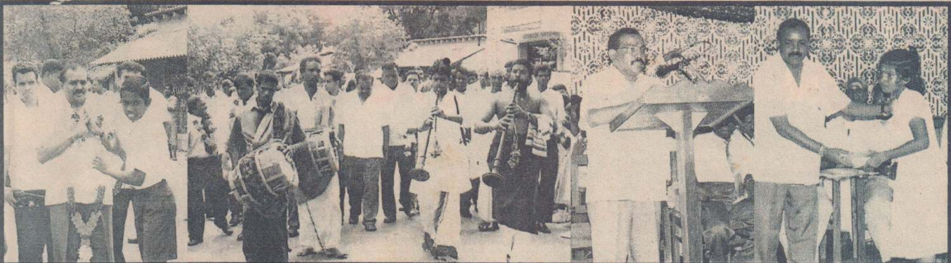
காரைநகர் யாழ்நகர் கல்லூரிக்கு அண்மையில் பிரதிக்கல்வி அமைச்சர் எம்.சச்சிதானந்தன் விஜயம் செய்த போது எடுக்கப்பட்ட படங்கள் இவை. பிரதிக்கல்வி அமைச்சரை கல்லூரி மாணவர் ஒருவர் மலர்மாலை அணிவித்து வரவேற்பதையும், அமைச்சரும் ஏனைய அதிகாரிகளும் மங்கள வாத்தியங்களுடன் பாடசாலைக்கு அழைத்து வரப்படுவதையும் முதல் இரு படங்களிலும், பிரதிக்கல்வி அமைச்சர் எம்.சச்சிதானந்தன் உரையாற்றுவதை மூன்றாவது படத்திலும், இவ்வாண்டு இடம் பெற்ற தரம் 5 புலமைப்பரிசில் பரிட்சையில் சித்தியடைந்த மாணவர் ஒருவருக்கு அமைச்சர் பரிசில் வழங்குவதை இறுதிப்படத்திலும் காணலாம்.