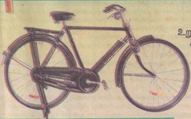
உறுதியின் அச்சாணி சிங்கர் ஸ்டேன்ட் சைக்கிள்கள்