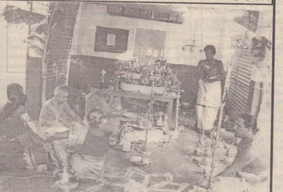
நவாலி வடக்கு தேற்றா மரத்தடி ஞானவைரவர் ஆலய சும்பாபிஷேகமும் சகஸ்ரநாம (1008) அர்ச்சனை வழிபாடும் அண்மையில் இடம் பெற்றன. சும்பாபிஷேகக் கிரியைகளை பிரதம குருமார் நடத்துவதைக் காணலாம்.