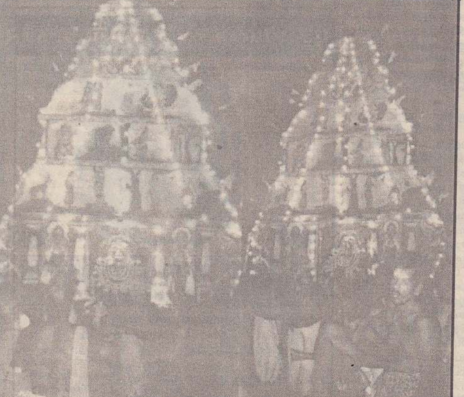
தொண்டைமானாறு செல்வச்சந்நிதி ஆலய பெருந்திருவிழாவின் சப்பரத் திருவிழாவில் மின்னொளி பொருத்தப்பட்ட அழகிய சப்பரத்தில் முருகப் பெருமான் வீதி உலா வரும் காட்சி. (எஸ். ஜி. மூர்த்தி)