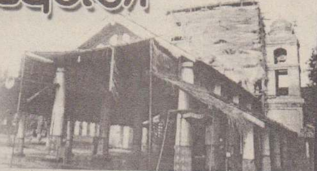
வசந்த மண்டபமும், ஈசான திசையில் யாக மண்டபமும் இருக்கின்றன.