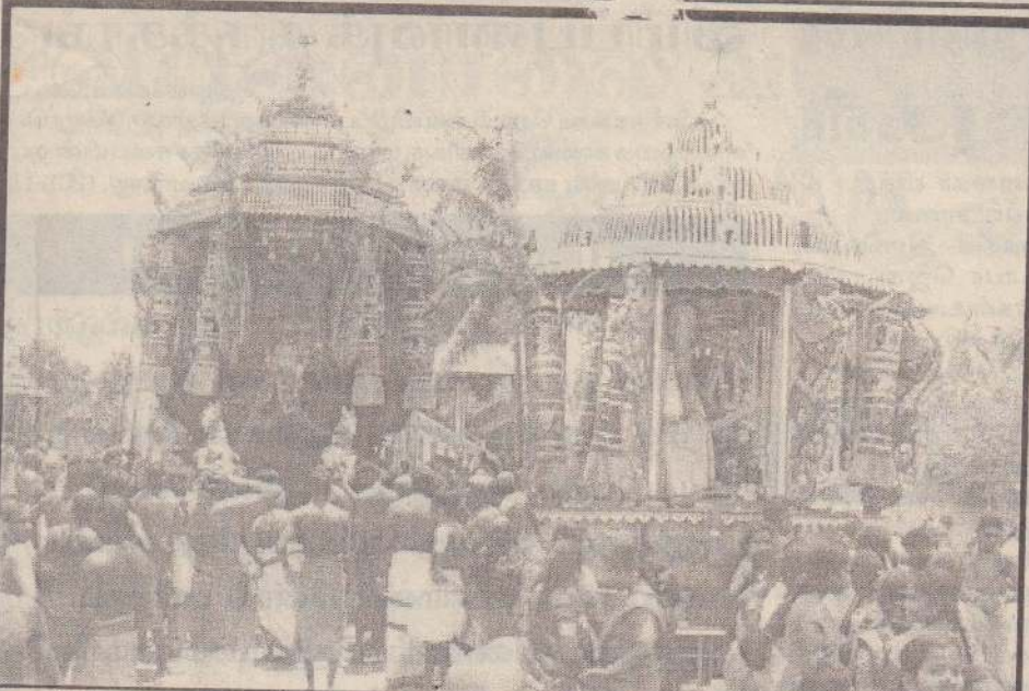
நீர்வேலி வாய்க்காற்றுவை மூத்த விநாயகர் ஆலயத் தேர்த் திருவிழாவில் எடுக்கப் பட்ட படங்கள்.