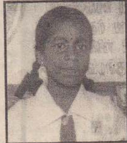
சத்தியசீலன் நிரோலா வயாவிளான் மத்திய மகா வித்தியாலயம் புள்ளிகள் - 148

எனது இந்த பரிட்சை வெற்றிக்கு உறுதுணையாக அமைந்த அதிபர், வகுப்பாசிரியர், எனக்கு ரியூசன் சொல்லித்தந்த செல்லம் அன்றி ஆகியோருக்கு இந்நேரத்தில் நன்றி கூறக் கடமைப்பட்டுள்ளேன்.