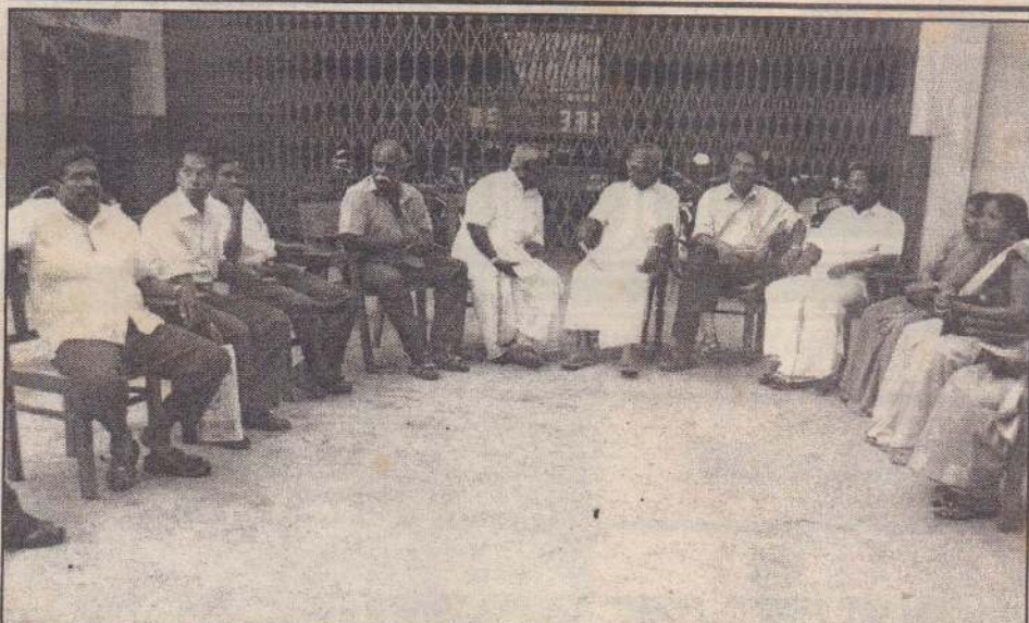
யாழ்.மாநகர சபையின் 25 ஆவது முதல்வர் தலைமையில் வைபவரீதியாக இடம்பெற்ற முதலாவது அமர்வின் முன்னதாக இடம்பெற்ற மாநகரசபை உறுப்பினர்களுக்கான ஆரம்ப வரவேற்பு நிகழ்வைப் புறக்கணித்து தமிழ்தேசியக் கூட்டமைப்பு சார் உறுப்பினர்கள் மாநகரசபையின் தீயணைப்புப் பிரிவின் முன்றலில் கூடியிருந்த போது எடுக்கப்பட்ட படம்.