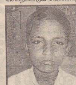
தர்மராசா சலீவன் மாவிப்பம் சத்திய சாமி பாடசாலை புள்ளிகள் - 156

வல்ல இறைவனை வேண்டுவதோடு எனது கல்விக்கு உறுதுணையாக செயற்பட்டுக் கொண்டிருக்கும் அனைவருக்கும் நான் நன்றி கூறக்கடமைப்பட்டுள்ளேன்.