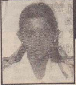
மனோகரன் வைஷ்ணவி வயாவிளான் மத்திய மகா வித்தியாலயம் புள்ளிகள் - 165

அண்மையில் வெளியாகிய புலமைப் பரிசில் பரிட்சையில் அந்தந்தப் பாடசாலை மட்டத்தில் அதிகூடிய புள்ளிகளைப் பெற்று பாடசாலைச் சமூகத்திற்கும் அவர்களின் பெற்றோர்களுக்கும் தமது சொந்த ஊருக்கும் பெருமை தேடிக்கொடுத்த மாணவச் செல்வங்களின் கருத்துக்களைத் தொகுத்து 'உதயன்' வாசகர்களுக்காகத் தருகின்றோம். தொடர்ந்து படியுங்கள்.