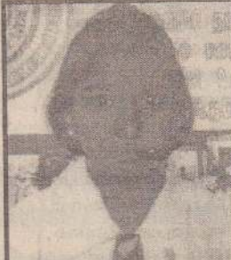
தாஸ்யந்தன் நாராயணா வயாவிளான் மத்திய மகா வித்தியாலயம் புள்ளிகள் - 165

எமது குடும்ப நிலையை உணர்ந்து படித்து முன்னுக்கு வந்து நல்லபடியாக வாழவேண்டும் என்ற எண்ணம் என் மனதில் தோன்றியது. எனது அம்மாவும் அதையே விரும்புகின்றார். அதற்காக எந்தக் கஷ்டத்தையும் எதிர்கொள்ள தான் தயாராகவே இருப்பதாக அம்மா அடிக்கடி சொல்வதுண்டு. எனக்கு விருப்பமான துறை விளையாட்டு (கிரிக்கெட்). அந்தத்துறையில் நான் சாதனை படைக்க வேண்டும். பாடசாலை மற்றும் கோட்ட/ வலய மட்டத்தில் நடைபெற்ற போட்டிகளில் பங்குபற்றியுள்ளேன். உயரம் பாய்தல் போட்டியில் முதலாம் இடத்தையும், நீளம் பாய்தல் போட்டியில் இரண்டாம் இடத்தையும் பெற்று பரிசில்களும், சான்றிதழ்களும் பெற்றுள்ளேன்.