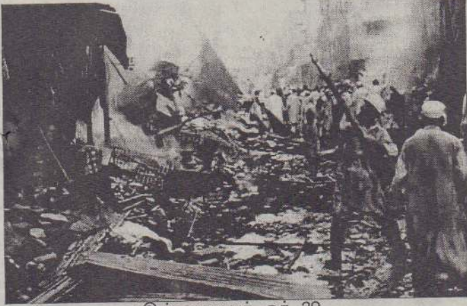
இஸ்லாமாபாத், ஓக். 29

பாசிஸ்தானின் பெஷாவர் சந்தைப் பகுதியில் நேற்று புதன்கிழமை இடம்பெற்ற பயங்கரக் குண்டுத்தாக்குதலில் 80 பேர் கொல்லப்பட்டனர். 150 இற்கு மேற்பட்டோர் காயமடைந்தனர். கட்டடங்கள் தீப்பற்றி எரிந்தன. புகை மண்டலங்கள் எழும்பி, வடமேற்கு நகரையும் மறைத்தன என பொலிஸ் வட்டாரம் தெரிவித்தது.