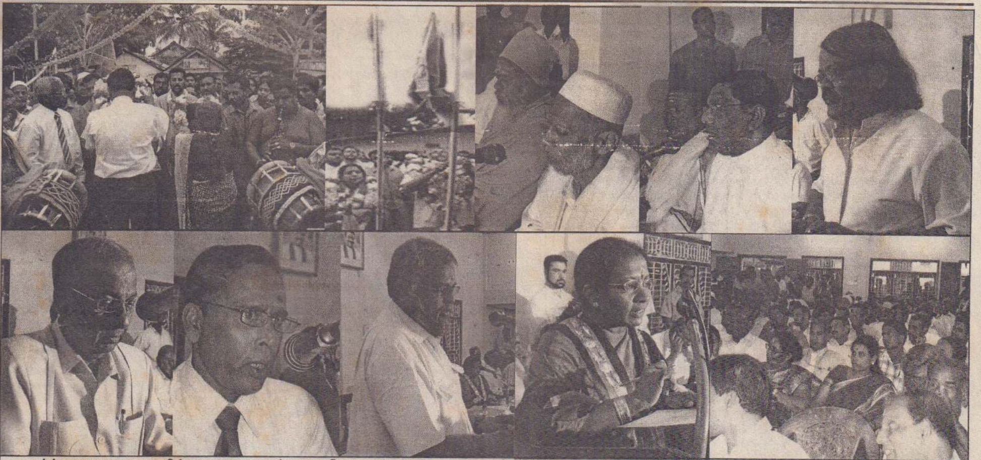
யாழ்ப்பாண மாநகரசபையின் முதலாவது அமர்வு நடைபெறுவதற்கு முன்னதாக இடம்பெற்ற ஆரம்ப வரவேற்பு நிகழ்வின் போது எடுக்கப்பட்ட படங்கள் இவை. முதல்வரும் ஏனையோரும் நல்லிர் முருகன் ஆலயத்தில் இருந்து அழைத்துவரப்படுவதையும், கொடிகள் ஏற்றப்படுவதையும், மதகுருமாள், விசேட விருந்தினர்கள், அமைச்சர், முதல்வர் ஆகியோர் உரையாற்றுவதையும் படங்களில் காணலாம்.