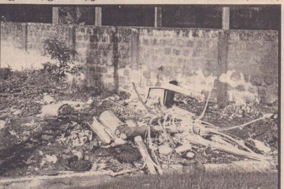
நாவலர் வீதியிலுள்ள புகையிரத நிலைய வீதியில் குப்பை, கூழங்கள் அளவுக் கதிசமாகக் கொட்டப்படுவதால் போக்குவரத்துக்குச் சிரமமாக உள்ளது என பொதுமக்கள் விசனம் தெரிவிக்கின்றனர். அத்துடன் அப்பகுதியில் போக்குவரத்துச் செய்யும்போது தூர்நாற்றம் விசுவதனால் பொதுமக்கள் பெரும் அசௌரியங்களை எதிர்நோக்குவதாகவும் கூறப்படுகின்றது. (படம்: அனு)

நவாலை, நவ.14 ஆணைக்கோட்டை, கல்லுண்டாய் இந்து மயானப் பகுதிச் சுற்றாடலில் மண் அகழப்படுவதால் கடல் நீர் வயல்கள், குடிமனைகள் ஆகியவற்றுள் உட்புகும் அபரிதம் ஏற்பட்டுள்ளது. கடந்த சில நாட்களாக உழவு இயந்திரங்கள்மூலம் மண் எடுத்துச் செல்லப்படுவதால் மயானத்திற்குச் செல்லும் வீதியும் சிதைந்து சீர்கெட்ட நிலையில் உள்ளதாகத் தெரிவிக்கப்படுகிறது. இது தொடர்பாக ஆணைக்கோட்டைப் பகுதியைச் சேர்ந்த பொது அமைப்பின் பிரதிநிதிகளும் மக்களும், சண்டிலிப்பாய் பிரதேச செயலர், யாழ்.அரசு அதிபர் ஆகியோருக்கு மகஜர்களை அனுப்பி வைத்துள்ளனர். (203-100)