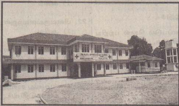
போற்றப்பட வேண்டிய உள்ளத முயற்சி

தெய்வீக பணிக்கு நிகரானது வைத்தியத்துறை சார்ந்த பணி. ஒருவனுக்கு துன்பம் நோயினாலும் ஏற்படுகிறது. அத்துயரில் அவன் வேதனை உறுகின்றபோது அவன் நாடும் இடம் நம்பிக்கையுடன் வைத்தியசாலை. அவனின் ஜீவனுக்கு ஆதாரம் கொடுப்பதும் வைத்திய சாலையும், வைத்தியர்களும். தென்மராட்சி மக்களின் துயர்தீர்க்க இன்று பூரணமான ஆதாரசாலை அமைவது அனைவருக்கும் மகிழ்வையும் மன நிறைவையும் தரும். வெளிநோயாளர் பிரிவு கட்டடம், மருத்துவக் களஞ்சியம், நோயாளர் தங்கு விடுதிகள் புதிதாக வசதிகளும் நிறைவு களும் உடையதாக அமைந்து இன்று திறப்புவிழா காணுகின்றது. இப்பணியின் நிறைவு மூலம் தென்மராட்சி மக்களின் ஓரளவு வைத்திய சேவை நிறைவு பெறுகின்றது. இப்பணிகள், இது போன்ற வைத்திய சாலை சார்ந்த சேவைகள், நிறைவேறு வேண்டும் என்ற சிந்தனையாலும், செயலாலும் அயராது உழைக்கும் மாவட்ட வைத்திய அதிகாரிக்கும், உத்தியோகத்தார்களுக்கும், ஊழியர்களுக்கும் நல்லாசிகள் தெரிவிப்பதுடன் சூழப்பாக இப்பணிகளுக்கு தம் முழுச்சக்தியையும் பயனுள்ளதாக பயன்படுத்தி திறப்புவிழா மூலம் மகிழ்வு காணும் வைத்தியசாலை அபிவிருத்திக்குழு உறுப்பினர்கள் அனைவருக்கும் சாவகச்சேரி சார்ந்த மக்கள் நன்றியுடையவர்கள் ஆக இருக்க வேண்டும். இவர்கள் பணிக்கு இறை ஆசிகள் கிடைக்கப் பிரார்த்தனைகள். "எல்லோரும் இன்புற்றிருக்க பிரார்த்தனைகள்" து.கு.ஜெகதீஸ்வரக்குருக்கர்