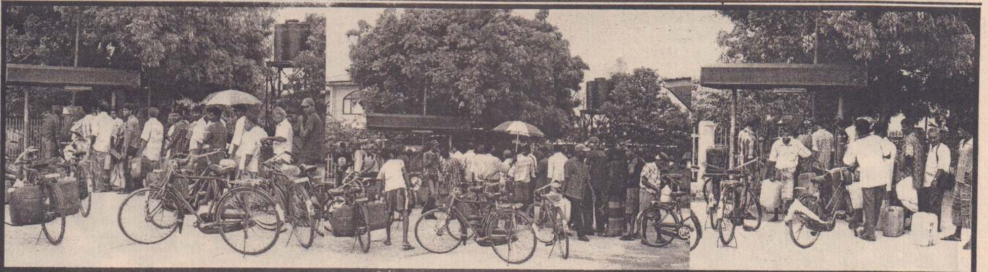
யாழ்.நகரில் உள்ள எரிபொருள் நிரப்பும் நிலையம் ஒன்றில் நேற்று மண்ணெண்ணெய் பெறுவதற்காக நீண்ட வரிசையில் காத்திருந்த மக்களைப் படங்களில் காணலாம்.