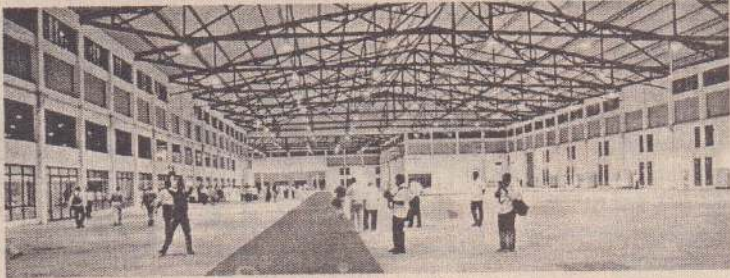
சென்னை, நவ. 14

கோவையில் நடைபெறவுள்ள உலகத் தமிழ் செம்மொழி மாநாட்டின் ஒரு பகுதியாக தமிழ் இணைய மாநாடும் நடத்தப்படும் - என்று தமிழக அரசு அறிவித்துள்ளது.