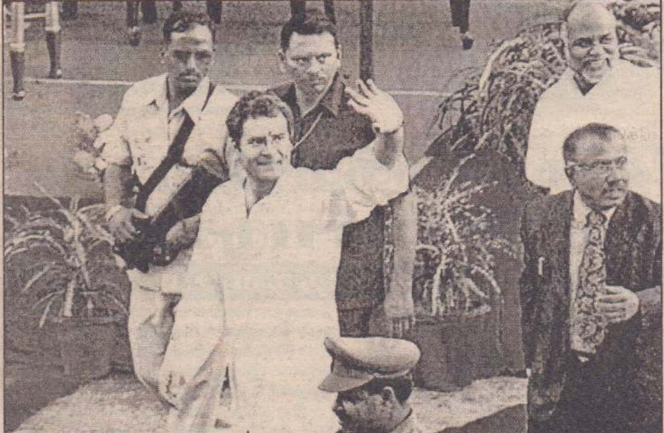
புதுவைக்கு வந்த ராகுல்காந்தி பூங்கா பல்சகலக்கூழாயத்தில் புதிதாக அமைக்கப்பட்ட ராஜீவ் காந்தி கிரிக்கெட் மைதானத்தைத் திறந்துவைத்தார். பின்னர் அவர் தொண்டர்களைப் பார்த்து கையசைத்தபோது எடுக்கப்பட்ட படம் இது.

மலேஷியாவின் பிளாங்கு மாநில துணை முதல்வர் ராமசாமி மாநாட்டைத் தொடங்கி வைத்துப் பேசியபோதே மேற்கண்டவாறு கூறினார். மேலும் அவர் கூறியவை வருமாறு - உலகம் எங்கும் பரந்து கிடக்கும் தமிழர்களுக்கு கடந்த காலங்களில் கசப்பான அனுபவங்கள்தான் ஏற்பட்டுள்ளன. உலக அளவில் உள்ள தமிழர்கள் பல்வேறு அச்சுறுத்தல்களுக்கு ஆளாகிவருகின்றனர். மலேஷியா, சிங்கப்பூர், மொரிசியஸ் உள்ளிட்ட பல்வேறு நாடுகளிலும் வாழும் தமிழர்களுக்கு அவரவர் வாழ்வுரிமை, மொழி ஆகியவற்றுக்குப் பல்வேறு அச்சுறுத்தல்களும் ஏற்பட்டுள்ளன. இந்தப் பிரச்சினைகளை, விவகாரங்களை இந்த மாநாட்டின் வழியாக நாம் விவாதிக்க வேண்டும்.