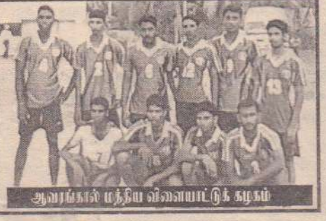
ஆவரங்கால் மத்திய விளையாட்டுக் கழகம்