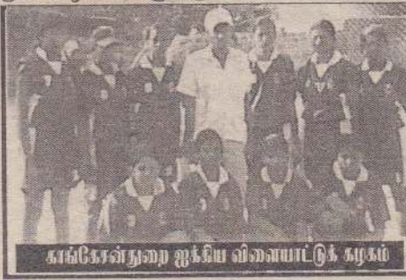
காங்கேசன்துறை ஐக்கிய விளையாட்டுக் கழகம்

பெற்று வந்த ஆண், பெண் இருபாலாருக்கும் இடையிலான கரப்பந்தாட்டச் சுற்றுப் போட்டியின் இறுதியாட்டத்தில் ஆண்கள் பிரிவில் ஆவரங்கால் மத்திய