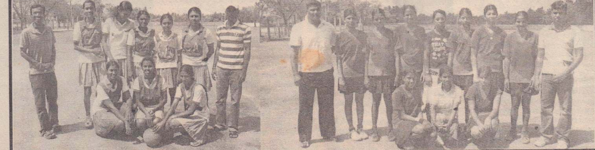
உடுவில் பிரதேச செயலாளர் பிரிவில் பதிவு செய்யப்பட்ட விளையாட்டுக் கழகங்களுக்கு இடையே நடைபெற்ற வலைப்பந்தாட்டப் போட்டியில் முதலாம் இடத்தைப்பெற்ற இறுதிவரை இந்து விளையாட்டுக் கழகம் இடத்தைப் பெற்ற உடுவில் மத்தி விளையாட்டுக் கழகம் ஆசியவற்றைச் சேர்ந்த வீரங்களைகளைப் புகழுகிறது. (படங்கள்: நேசன்)

கூடநாட்டு விளையாட்டு அரங்குகளில் கூடைப்பந்தாட்டப் போட்டியில் மத்திய கல்லூரி அணிக்கு வெற்றி! யாழ்ப்பாணம், பெப்.8 'எக்ஸ்போ எயார்' விமானசேவை நிறுவனத்தின் அனுசரணையுடன் யாழ். நகர் மைய நோட்டரக்ட் கழகம் நடத்தும் பாடசாலைகளுக்கிடையிலான ஆண், பெண், இருபாலாருக்கும்ான கூடைப்பந்தாட்டச் சுற்றுப் போட்டியில் ஆண்களுக்கான போட்டி ஒன்று அண்மையில் யாழ். இந்துக்கல்லூரி கூடைப்பந்தாட்டத்திடலில் இடம்பெற்றது. இதில்