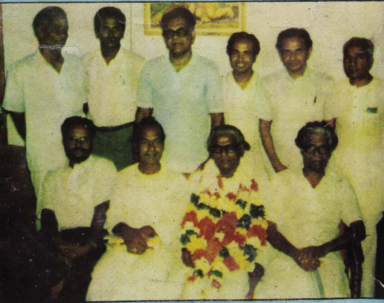
Dignized by Noolaham Foundali noolaham.org | aavanaham.org