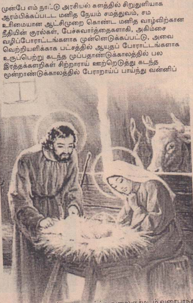
பெருநிலப்பரப்பு வரைபாய்ந்து வலைஞர்மடம் வரைபரந்து பெரும் இரத்த வெள்ளமாகப் பரணமித்து ஓய்ந்துள்ள நிலையில் இன்றைய கிறிஸ்து பிறப்புவிழா உதயமாகிறது. எம்மிடையே அசைந்து, ஆடி அலைக்கழித்து, ஓய்ந்துவிட்டபெரும் போர்ப்புயல் எம் இனத்தின் மேல் பதித்துச் சென்ற ஆற்றமுடியாத வடுக்களோ, உடல் உள வேதனைகளோ மாற்ற முடியாதவை; மறுக்க இயலாதவை என்பது உண்மையான நீதி புலப்படும் நாளில் நிஜமாகும்.

“உலகெங்கும் உள்ள மக்கள் அனைவரும் நம் கடவுள் அருளிய விடுதலையைக் கண்டனர்.” (திரு.பா.198:3) மனுக்குல வரலாற்றில் மாபெரும் சாதனையானதாக தமது சொல்லாலும் செயலாலும் விளங்குவதே இறைமகனாம் இயேசுக்கிறிஸ்து. “கடவுள் வடிவில் விளங்கிய அவர், கடவுளுக்கு இணையாயிருக்கும் நிலையை வலிந்து பற்றிக் கொண்டிருக்க வேண்டிய தொன்றாகக் கருதவில்லை; ஆனால் தம்மையே வெறுமையாக்கி, அடிமையின் வடிவை ஏற்று மனிதருக்கு ஒப்பானார்” (பிலிப்: 2:6-7) என்ற மறைநூல் வாக்கிற்கு ஏற்ப கடவுளாகிய இயேசுக்கிறிஸ்து பால உலகில் மூழ்கி அழிவின் வாழ்வை நோக்கிச் செல்லும் மனித குலத்தை மீட்க, உண்மையான மனிதநேயத்துடன் இம் மண்ணுலகில் மனித அவதாரம் எடுத்த உன்னத விடுதலையின் நாளை யே இறைக்கு ஈராயிரம் ஆண்டுகளுக்கு மேலாக நத்தார் நன்நாளாகக் கொண்டாடி மகிழ்கின்றோம் என்பது அனைவரும் உணர்ந்த உண்மை. எனினும் சமகால சூழலில் கிறிஸ்துவின் பிறப்பை எதிர்நோக்கிக் காத்திருந்து பல ஆயத்தங்களை முன்னெடுத்து இன்று எம் மீட்பாரம் கிறிஸ்து பிறப்பு விழாவில் எம் உள்ளங்களும், இல்லங்களும், ஏன் சமுதாயமும் நாடும் மகிழ்கின்றதென்றால் அதன் உண்மையான அர்த்தத்தை நாம் ஆழ்ந்து சிந்திக்க வேண்டும். இன்றும் எம் மத்தியில் பேசப்படும், செயல்படுத்தப்படும் மனித நேயம் மனித உரிமைகளுக்கும் இறைமகன் கிறிஸ்து அளித்த மனித நேயம், மனுக்குலவிடுதலைக்கும் எவ்வாறான தொடர்பு உண்டு? என்பதை உள்ளத்தாய்மையில் விளங்கும் நீதியின் கண்ணோட்டத்தில் உற்றுநோக்க எம் மத்தியிலே பாலகவடிவில் பிறந்துள்ள நீதியின் அரசராம் இயேசு அழைப்பு விடுக்கின்றார். இறைக்கு அறுபது ஆண்டுகளுக்கு