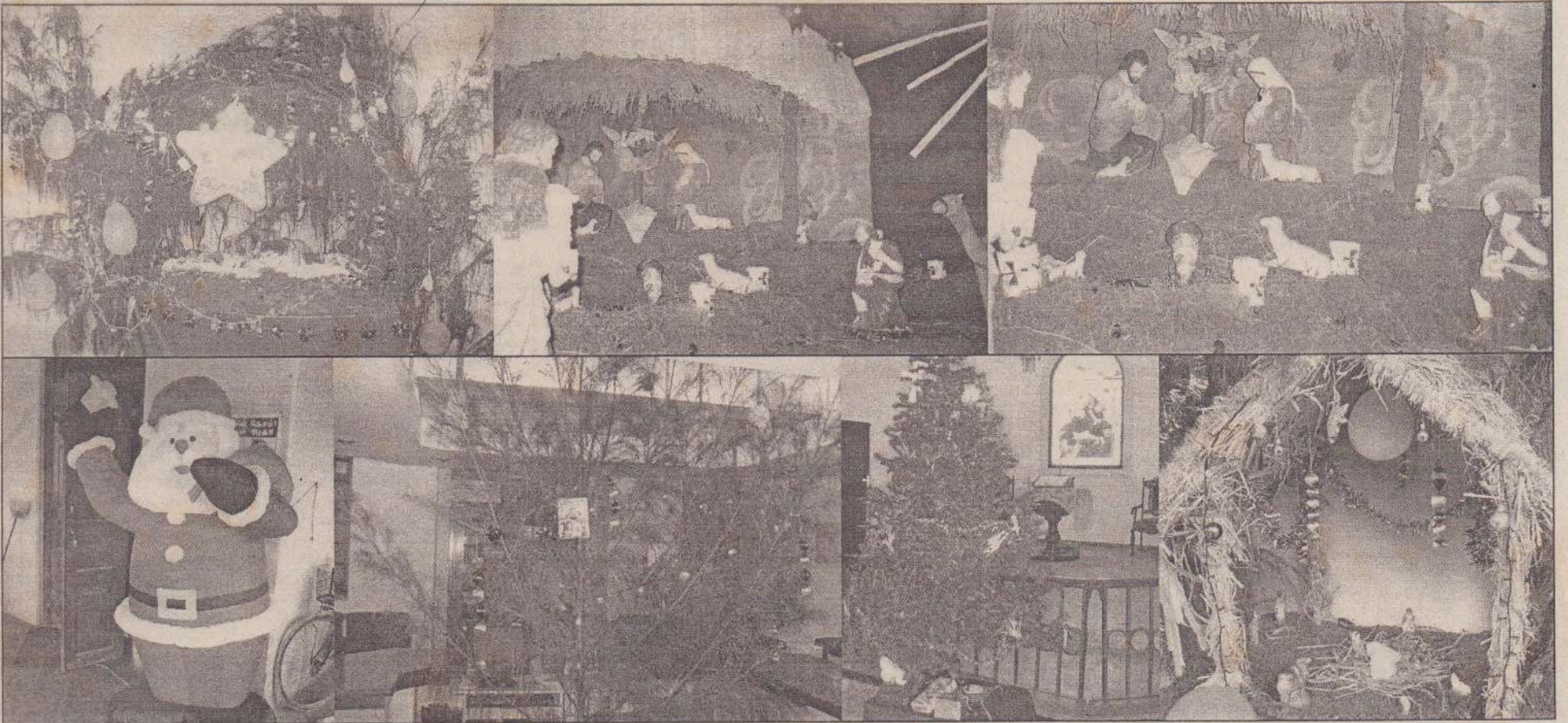
நத்தார் தினக் கொண்டாட்டங்களின் போது பாலன் யேசுவின் பிறப்பை ஒட்டி யாழ். நகரிலும் மற்றும் பல இடங்களிலும் அலங்காரங்கள் செய்யப்பட்டுள்ளன. யாழ். போதனா வைத்தியசாலையிலும், யாழ். பெரிய கோயிலிலும் அமைக்கப்பட்ட நத்தார் பந்தல்களை மேல்வரிசையிலும், வந்தக நிலையம், யாழ். பொது நூலகம், சதோச மற்றும் தேவாலயத்தில் அமைக்கப்பட்டிருந்த நத்தார் பந்தல்களை கீழ் வரிசையிலும் காணலாம்.