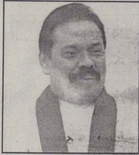
அமெரிக்க விரோதப் போக்கென்பது உலகளாவிய ரீதியில் பிரபலமானது. அது அரபியர் கலையாகியுள்ளது. அதற்கமைய, இலங்கையை வெறுத்தொதுக்கி நாட்டினின்றும் வெளியேறி, அமெரிக்காவுக்குச் சென்று அமெரிக்கக் குடியரிமையைப் பெற்றுக் கொண்டுள்ளோரும் கூட அமெரிக்க விரோதமென்ற போக்கைப் பின்பற்றும் தரப்பினராகியுள்ளனர். எந்தவொரு சம்பவத்தின் பின்புலத்திலும் அமெரிக்க அதிகாரமொன்று இருப்பதாக உருவகப்படுத்திப் பார்ப்பதற்கும் சிலர்