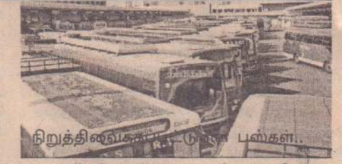
நிறுத்திவைக்கப்பட்ட தொடர் பஸ்கள். என்ற சினிமாவின் படப்பிடிப்பு நேற்று முன்தினம் கோதாவரி நிலக்கரிச் சுரங்கத்தின் அருகே தொடங்கியது. திடீரென அங்கு திரண்டு வந்த தெலுங்கானா ஆதரவாளர்கள் படப்பிடிப்பை நிறுத்துமாறு எச்சரிக்கை விடுத்தனர். உடனே, இயக்குநர் சேகர்கம்முல் அவர்களை சமாதானப்படுத்த முயன்றார். அப்போது தனித் தெலுங்கானாக்கோரிக்கைக்கு பகிரங்க ஆதரவு தெரிவித்தால் படப்பிடிப்பை தொடர்ந்து நடத்தலாம் என்று அவர்கள் தெரிவித்தனர். இதேபோன்று, ஐதராபாத்தில் ஹயத் நகரில் நடிகர் விஸ்வாஸ் கதாநாயகனாக நடிக்கும் படத்தின் படப்பிடிப்பை நிறுத்த தெலுங்கானா ஆதரவாளர்கள் திரண்டு வருகின்றனர் என ஹயத் நகர் பொலிஸார் எச்சரித்தனர். உடனே, அவர்கள் படப்பிடிப்பை ரத்து செய்து விட்டு அவசரமாக கிளம்பிச் சென்றனர்.