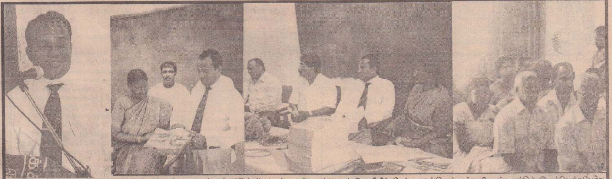
லங்கா சித்த ஆயுள்வேத மருத்துவக் கல்லூரி மாணவர் மன்றத்தின் "மக்கள் மருத்துவன்" நூல் வெளியீடு நேற்று முன்தினம் கல்லூரி மண்டபத்தில் இடம்பெற்றபோது எடுக்கப்பட்ட படங்கள் இவை.

இந்த வீதியில் பாம்பினால் கடியுண்டவர்கள் சாவகச்சேரி ஆதார வைத்தியசாலையில் சிகிச்சைபெற்று வருவதாகவும் தெரிவிக்கப்பட்டது. (04-201)