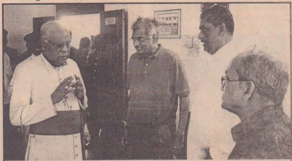
மன்னார் ஆயர் இராயப்பு ஜோசப்பை எதிர்க்கட்சிகளின் பொதுவேட்பாளர் சரத் பொன்சேகா, எதிர்க்கட்சித் தலைவர் உட்பட குழுவினர் கடந்த ஞாயிற்றுக்கிழமை சந்தித்ததைப் பட்டத்தில் காணலாம்.

நடைபெற்ற ஊடகவியலாளர் சந்திப்பில் கலந்துகொண்டபோதே அவர் இதனைக் குறிப்பிட்டுள்ளார். ஜெனரல் சரத் பொன்சேகாவின் முழுக் குடும்பமும் ஆயுதக் கொள்வனவு விவகாரத்துடன் தொடர்புபட்டுள்ளது எனவும், அதற்கான ஆதாரங்கள் காணப்படுகின்றன எனவும் அவர் தெரிவித்தார். ஆயுதக் கொடுக்கல் வாங்கல்கள் தொடர்பில் பகிரங்க விவாதமொன்றிற்குத் தாம் தயார் எனவும், ஜெனரல் சரத் பொன்சேகாவின் எந்தவொரு பிரதிநிதியையும் விவாதத்தில் சந்திக்கத் தயார் எனவும் அவர் தெரிவித்துள்ளார். ராஜபக்ஷ குடும்பத்தினர் மீது எதிர்க்கட்சிகள் சுமத்திவரும் குற்றச்சாட்டுக்கள் அடிப்படையற்றவை. இவ்வாறான குற்றச்சாட்டுக்களை அடிக்கிச் செல்லும் எதிர்க்கட்சிகள் இதுவரையில் எந்தவொரு ஆதாரத்தையும் சமர்ப்பிக்கவில்லை எனவும் அவர் குறிப்பிட்டுள்ளார். ஜெனரல் சரத் பொன்சேகா மீது சுமத்தப்பட்டுள்ள சகல குற்றச்சாட்டுக்கள் உண்மையானவை எனவும், அது தொடர்பான முழுப் பொறுப்பையும் தாம் ஏற்றுக் கொள்வார் எனவும் அமைச்சர் தெரிவித்துள்ளார். (சி)