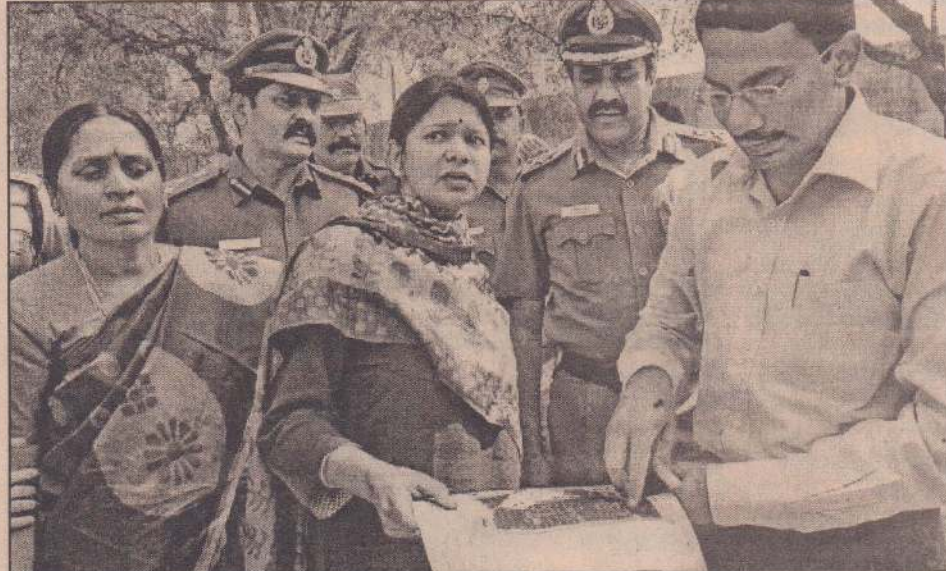
உலகத் தமிழ் மாநாட்டையொட்டி கோவை மத்திய சிறை வளாகத்தில் செம்மொழி மாநாட்டுப் பூங்கா அமைக்கப்படுகிறது. அதற்கான இடத்தை கனிமொழி எம்.பி. ஆய்வு செய்தபோது...

இதனால் காஷ்மீர் மாநிலம் பிற பகுதிகளில் இருந்து துண்டிக்கப்பட்டுள்ளது. பனி மூட்டத்தின் காரணமாக ஸ்ரீநகர் சர்வதேச விமான நிலையத்திற்கு நேற்றுமுன்தினம் காலைவில் விமானங்கள் வந்து செல்வதில் பெரும் பாதிப்பு ஏற்பட்டது. குளிர்க்கு உத்தரப் பிரதேசத்தில் கடந்த ஞாயிறன்று இரவு 4 பேரும், பீகாரில் நேற்றுமுன்தினம் 8 பேரும், அரியானாவில் 2 பேரும் பலியானார்கள். இதைத்தொடர்ந்து, வட மாநிலங்களில் குளிர்க்கு பலியானவர்களின் எண்ணிக்கை 120 ஆக உயர்ந்தது. உத்தரப் பிரதேசத்தில் மட்டும் குளிர்க்கு இதுவரை 110 பேர் பலியாகி உள்ளனர்.