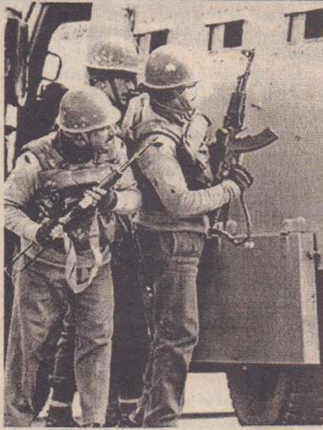
இராணுவத்தினர் மீது தாக்குதல் நடத்தியபடி அருகில் இருந்த 'பஞ்சாப் ஹோட்டல்' என்ற ஹோட்டலுக்குள் ஓடி ஒளிந்தனர். பின்னர் ஹோட்டலுக்குள் இருந்தபடி இராணுவத்தினரை நோக்கிச் சரமாரியாக சுட்டுக் கொண்டே இருந்தனர். அவர்களைப் பிடிக்க இராணுவத்தினர் ஹோட்டலைச் சுற்றி வளைத்து பதிலுக்குச் சரமாரியாக துப்பாக்கிச் சூடு நடத்தினார்கள். இரு தரப்பிலும் கரும் சண்டை நீடித்தது. இதனால் பயந்து அலறிய பொதுமக்கள் நாலா புறமும் சிதறி ஓடினர். இரு தரப்பிலும் கடுமையான சண்டை நீடித்ததால், அருகில் இருந்த கட்டடங்களில், கடைகளில் பதுங்கியிருந்த பொதுமக்களைப் பத்திரமாக மீட்டு வெளியே கொண்டு வந்தனர். 100 இற்கும் மேற்பட்ட பொதுமக்கள் மீட்கப்பட்டுப் பத்திர

துணை இராணுவத்தினரும் திருப்பிச் சுட்டார்கள். அப்போது 2 தீவிரவாதிகள் தப்பி ஓடி விட்டனர். 2 தீவிரவாதிகள், இராணுவத்தினர் மீது தாக்குதல் நடத்தியபடி அருகில் இருந்த 'பஞ்சாப் ஹோட்டல்' என்ற ஹோட்டலுக்குள் ஓடி ஒளிந்தனர்.