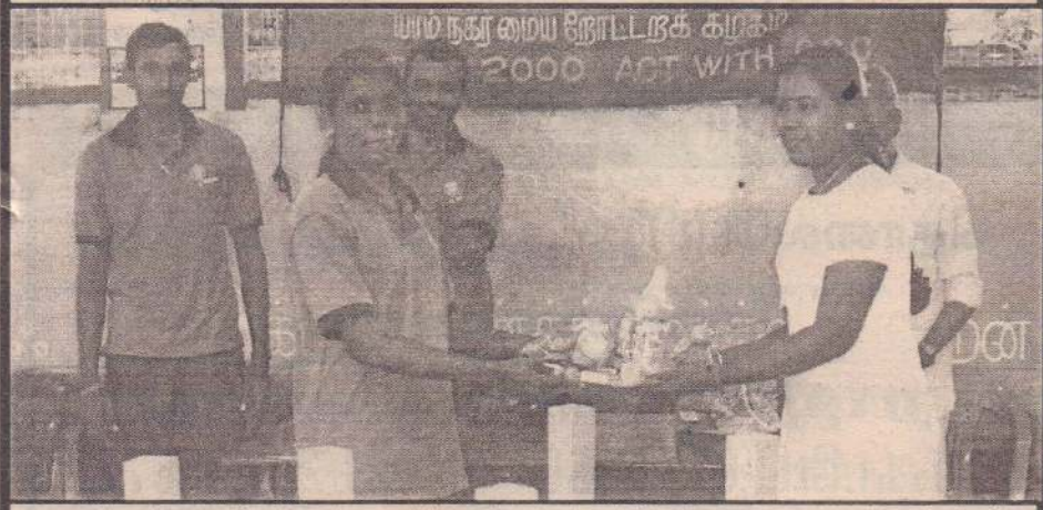
பாழ்நகர்வாசல் நோட்டீஸ் கழகத்தில் ஏற்பாட்டில் வல்வெட்டித்துறை கணபதி முன்பள்ளிக்கு கற்றல் உபகரணங்கள் கழகத் தலைவியால் வழங்கப்பட்ட போது எடுக்கப்பட்ட படம்.