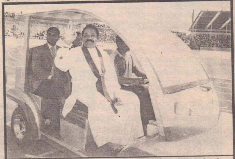
ஹொமாகம், தியாகமவில் மஹிந்த ராஜபக்ஷ சர்வதேச விளையாட்டரங்கை ஜனாதிபதி மஹிந்த ராஜபக்ஷ நேற்று முன்தினம் திறந்து வைத்த பின்னர் மைதான வாகனத்தில் ஏறி, ஓடு திடலைச் சுற்றி வந்தபோது எடுக்கப்பட்ட படம் இது.