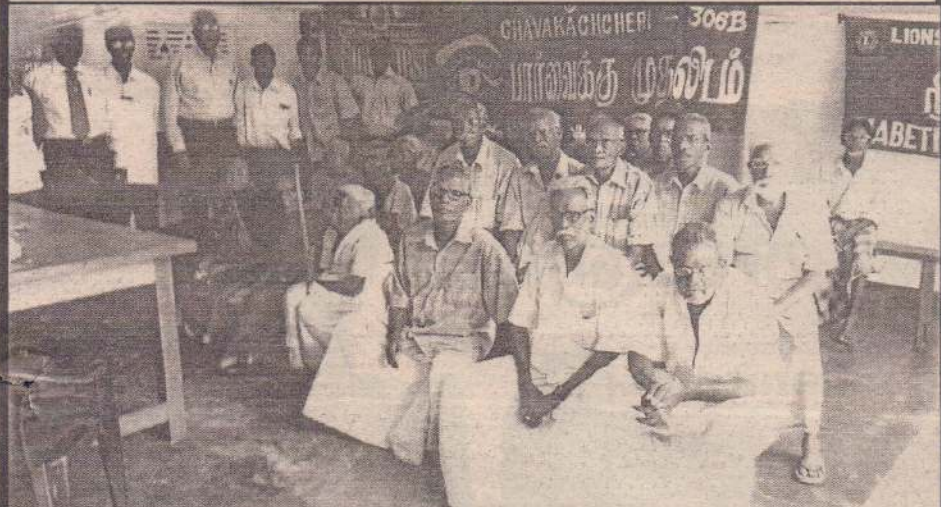
சாவகச்சேரி லயன்ஸ் கழகத்தில் இலவச மருத்துவ பரிசோதனை முகாம் மட்டுவில் வளர்மதி சனாசனக நிலைய மன்றப் படத்தில் இடம்பெற்றபோது எடுக்கப்பட்ட படம். இந்த நிகழ்வில் ஊக்குக் கல்வியைப் பெற்ற பயிற்சிகளுடன் கழக உறுப்பினர்கள் நிற்பகை யும் காணலாம். (50-207)