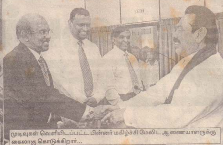
முடிவுகள் வெளியிடப்பட்ட பின்னர் மகிழ்ச்சி மேலிட ஆணையாளருக்கு கைலாகு கொடுக்கிறார்...