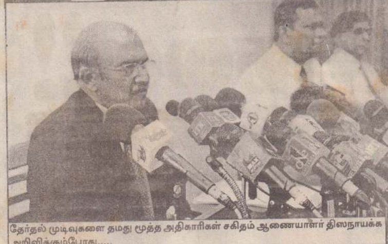
தேர்தல் முடிவுகளை தமது மூத்த அதிகாரிகள் சகிதம் ஆணையாளர் திஸநாயக்க அறிவிக்கும்போது.....