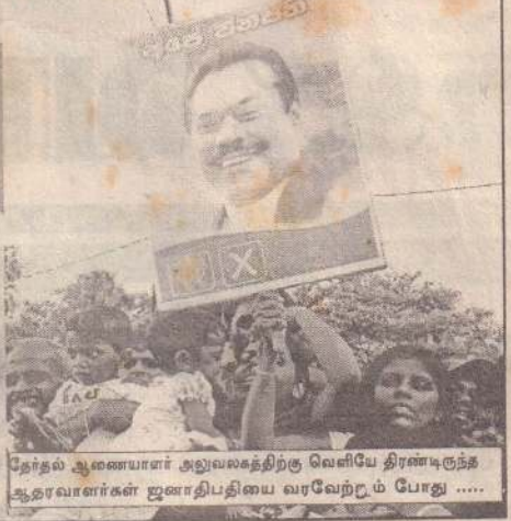
தேர்தல் ஆணையாளர் அலுவலகத்திற்கு வெளியே திரண்டிருந்த ஆதரவாளர்கள் ஐனாதிபதியை வரவேற்றும் போது .....