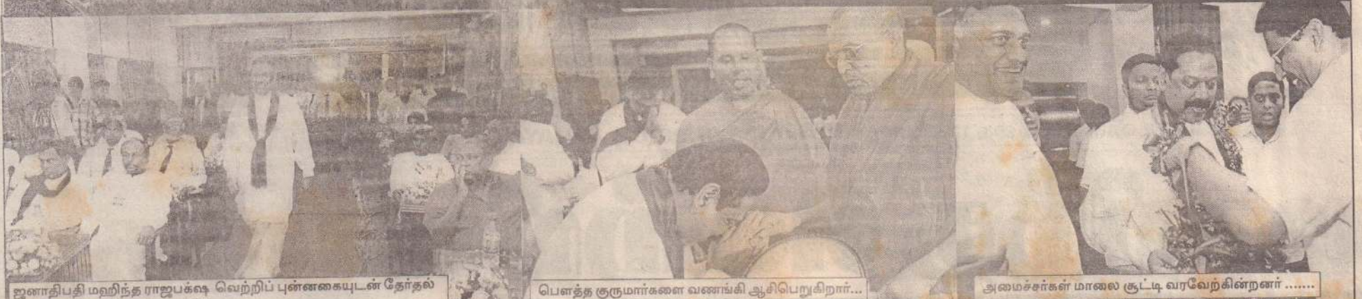
ஐனாதிபதி மஹிந்த ராஜபக்ஷ வெற்றிப் புள்ளிகையுடன் தேர்தல் ஆணையாளரின் மண்டபத்தில்.....