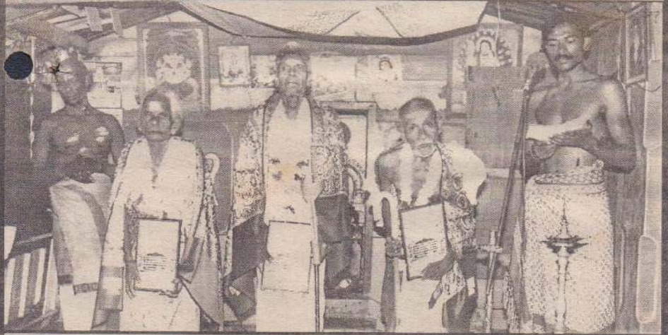
ஆனைக்கோட்டை ஸ்ரீ வல்லியப்பர் சுவாமி ஆலயத்தில் ஆனைக்கோட்டை இந்து இளைஞர் மன்றத்தினர் அனுசரணையுடன் முதியோரைக் கௌரவிக்கும் நிகழ்வு அண்மையில் இடம்பெற்ற போது எடுக்கப்பட்ட படம். இந்த நிகழ்வில் கௌரவிக்கப்பட்ட முதியோர்களைப் படத்தில் காணலாம்.