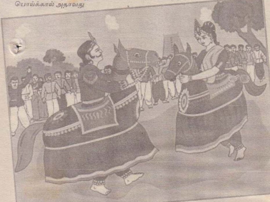
போலியான மரக்கால், கம்பு போன்றவற்றின் மேல் கால்களைப் பதியவைத்து தரையில் மரைக்குற்றிக் கம்பு போன்றவை நிலத்தில் ஊன்று நின்று ஆடும் முறையே பொய்க்கால் ஆட்டம் என்பர்.

வடமராட்சியில் ஒரு காலத்தில் பொய்க்கால் குதிரை ஆட்டம் மிகப்பிரபல்யம் வாய்ந்த கலை நிகழ்வாக இருந்ததாக அறியப்படுகின்றது. பொய்க்கால் அதாவது