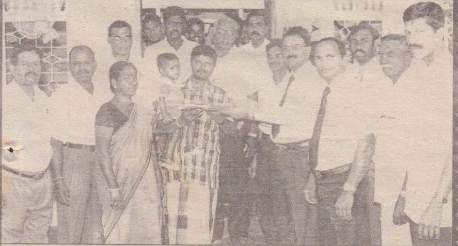
தேசிய சேயிப்பு வங்கியின் வடமகாணா அஞ்சல் வங்கிக்கிணையினால் காங்கேசன்துறைத் தயால் அதிபர் பிரிவில் கணக்குத் திறக்கும் வைபவம் அண்மையில் ஆரம்பித்து வைக்கப்பட்டது. இதன்போது அதிசூடிய தொகையை வைப்பிவிட்ட வகுக்கு வங்கி முகாமுக்கு வங்கி முகாமுக்கு மகேந்திரசிங்கம் அன்பளிப்பு வழங்குவதையும் படத்தில் காணலாம்.