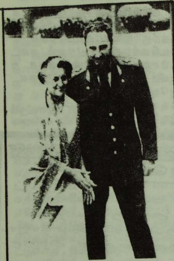
இந்தியப் பிரதமர் இந்திராவும் தியூபா ஜெனரல் கார்லோசும்

புதுடெல்லியில் நடைபெற்ற அணிசேரா நாடுகளின் ஏழாவது உச்சி மாநாடு இந்திய அரசியல் தந்திரத்தின் திறமையும், பெருமையையும் உயர்த்தியுள்ளதுடன் விடுதலை இயக்கங்களுக்கு சார்பானதும், முதலாளித்துவத்திற்கு எதிரான கொள்கையையும் நிறம் பார்த்துவந்த அரசியல் பேதைகளின் விழிகளை இம் மாநாட்டு முடிவுகள் பிதுங்கச் செய்துள்ளன.