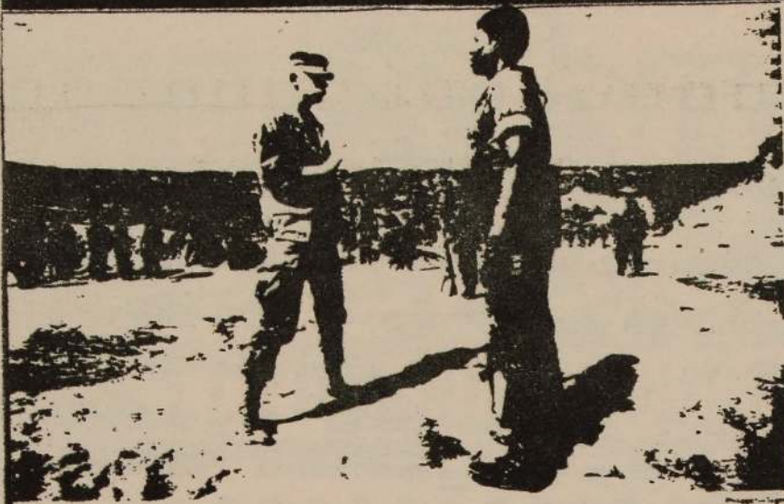
An American advisor lectures a Salvadoran soldier.