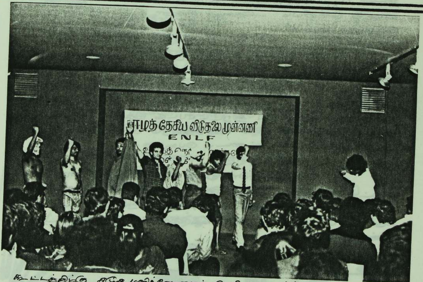
காட்டத்திற்கு எடுக்க முடிந்ததெல்லாம் பெரிதும் கவர்ந்த மே. தினம் உருவகச் சித்திரம்.