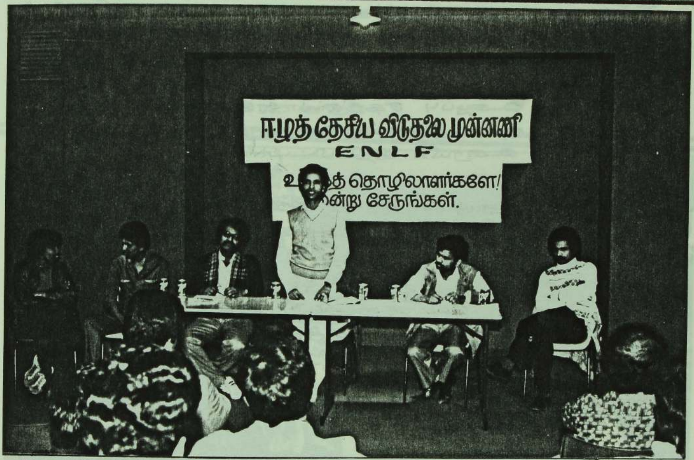
நாடந்தேசிய விடுதலை முன்னணியின் மேதனைக் கூட்டத்தில் தகையமயுரை சிகரத்தும் தோழர் அத்தோணிப்பினர்கா.

நாடந்தேசிய விடுதலை முன்னணியின் மேதனை முடிக்கம்