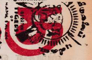
விடுதலைப்புலிகள் - மே 1983

A: It's a Jaffna students' organisation.