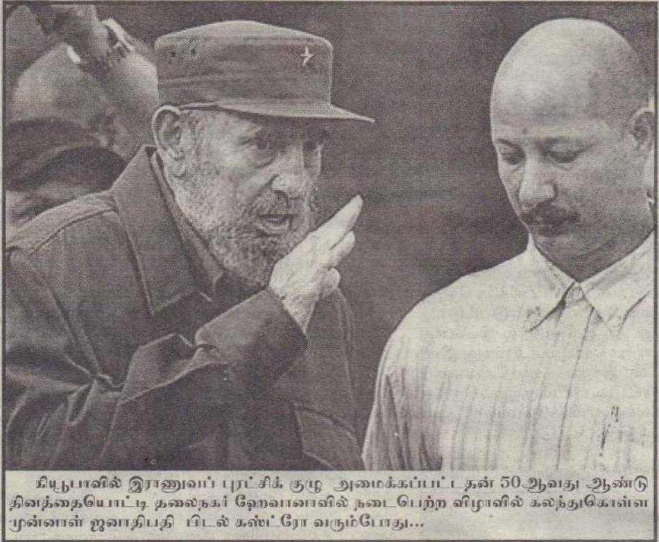
கியூபாவில் இராணுவப் புரட்சிக் குழு அமைக்கப்பட்ட தன் 50ஆவது ஆண்டு தினத்தையொட்டி தலைநகர் ஹேவானாவில் நடைபெற்ற விழாவில் கலந்துகொள்ள முன்னாள் ஜனாதிபதி டிடல் கன்ட்ரோ வரும்போது...