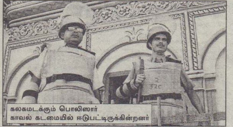
கலகமடக்கும் பொலிஸார் காவல் கடமையில் ஈடுபட்டிருக்கின்றனர்