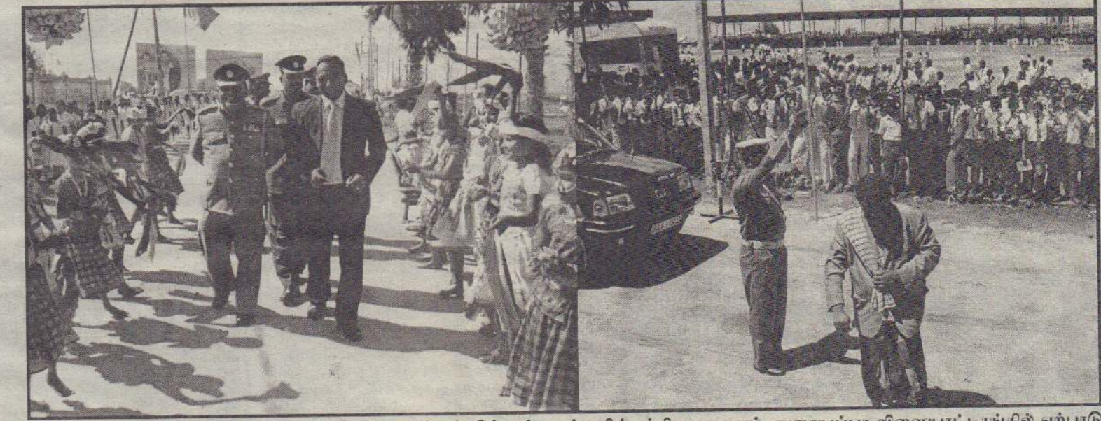
யாழ். பொலிஸ் தலைமை யகத்தின் போக்குவரத்துப் பிரிவால் கடந்த திங்கட்கிழமை யாழ். துறைமுகப் பகுதியில் ஏற்பாடு செய்யப்பட்ட மாபெரும் வீதி ஒழுங்கு விழிப்புணர்வுக் கண்காட்சியின் போது எடுக்கப்பட்ட படங்கள் இவை.

யாழ்ப்பாணம், செப்.30 யாழ். நாவாந்துறைப் பகுதியில் உள்ள கழிவுநீர் ஓடும் வடிகால் வாய்க்கால்கள் பல தூர்ந்து போன நிலையில் காணப்படுவதால் அவற்றில் கழிவு நீர் தேங்கி நின்று நுளம்பின் பெருக்கம் அதிகரித்துக் காணப்படுவதாகத் தெரிவிக்கப்படுகின்றது.