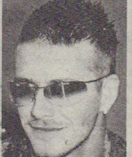
இதனைக் கேட்டதும் பெக்காம் அந்த ரசிகருடன் கடுமையாக வாக்குவாதத்தில் ஈடுபட்டார். இதுவும் அப்படியே ஜெஸைன்ஸ்சியில் ஓளிப்படப்பட்டது. மேலும் லண்டனின் 'நியூஸ் ஒவ் தி வீரர்ல்ட்' பத்திரிகை பெக்காம், ரசிகருடன் வாக்குவாதத்தில் ஈடுபட்டதைப் பட்டத்துடன் செய்தியாக வெளியிட்டது. இந்தச் செய்தியால் இங்கிலாந்தில் பெக்காமின் செல்வாக்கு கிட்டத்தட்ட வெறுமையாகிவிட்டது. மேலும், 2018ஆம் ஆண்டு உலகக் கிண்ணப் போட்டியை நடத்தும் வாய்ப்பை இங்கிலாந்துக்குப் பெற்றுத்தரும் குழுவுக்கும் பெக்காம் தலைவராக இருக்கிறார். அந்தப் பதவியிலிருந்து பெக்காமை நீக்க வேண்டும் என்றும் கோரிக்கை எழுந்துள்ளது. லொஸ் ஏஞ்சல்ஸ் கெல்க்சி வீரர்களிலேயே அதிக சம்பளம் பெறும் வீரர் பெக்காம். வருடத்திற்கு 70 லட்சம் அமெரிக்க டொலர்களைச் சம்பளமாக அவர் பெறுகிறார். முன்னாள் 'ஸ்பைஸ்கேர்ன்' விக்டோரியாதான் இவரது மனைவி. இந்தத் தம்பதியர்க்கு 3 குழந்தைகள் உள்ளனர். இவர்கள் இருவரும் உலகிலேயே விலை அதிகமுள்ள பகுதியாகக் கருதப்படும் லொஸ் ஏஞ்சல்ஸின் பெவ்லிஹில்சில் ஒரு கோடி 90 லட்சம் டொலர் மதிப்புள்ள வீட்டில் வசித்துவருகின்றனர் என்பது குறிப்பிடத்தக்கது.