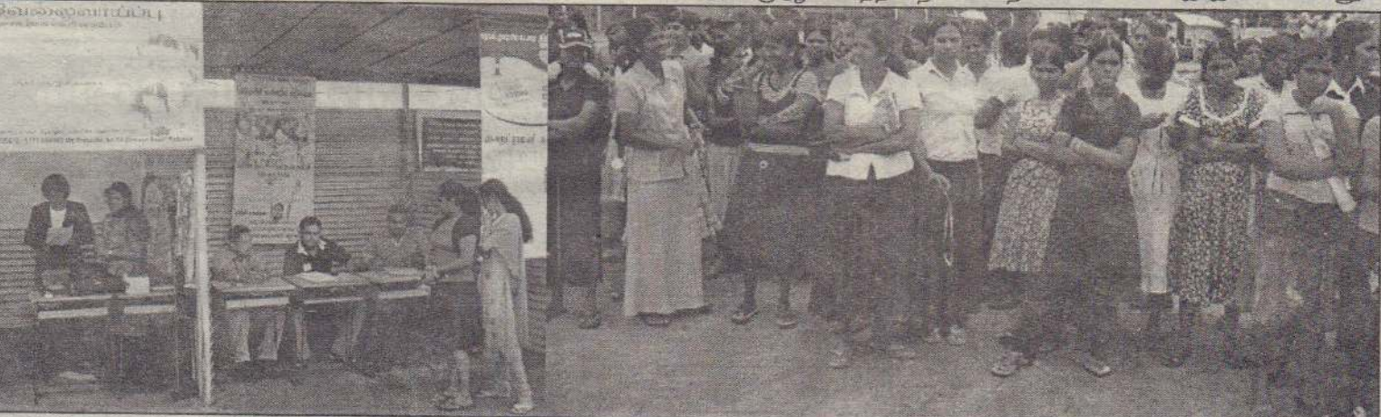
தடுப்பு முகாம்களில் இருந்து விடுவிக்கப்பட்ட முன்னாள் விடுதலைப் புலிகளின் உறுப்பினர்களுக்கான தொழில் வாய்ப்புப் பற்றிய முகாம் நேற்று வவுனியாவில் இடம்பெற்றபோது எடுக்கப்பட்ட படங்கள் இவை.