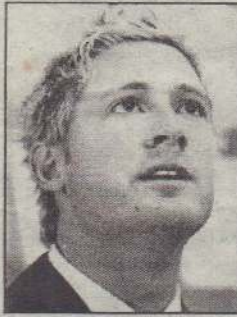
சண்டிகர், செப். 30 “ஹர்பஜன் சிங்கோடு நாங்கள் மோதல் போக்கைக் கடைப்பிடிக்கப் போவதில்லை. ஹர்பஜன் என்ற பந்துவீச்சாளரை மட்டுமே நாங்கள் எதிர்கொள்வோம்”

- இவ்வாறு ஆஸ்திரேலிய அணியின் துணைத்தலைவரான மைக்கல் கிளார்க் கூறியுள்ளார். இந்திய - ஆஸ்திரேலிய அணிகளுக்கிடையிலான 2 டெஸ்ட் போட்டிகளைக் கொண்ட தொடரின்,