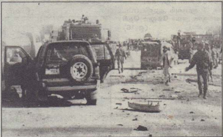
குண்டு வெடித்த இடத்தில் சோதனை நடத்தும் பொலிஸார்

ஆப்கானிஸ்தானில் பொதுவாகத் தங்களுக்கு எதிராகச் செயல்படும் அரசு அதிகாரிகளைத் தலிபான்கள் குறிவைக்கின்றனர்.