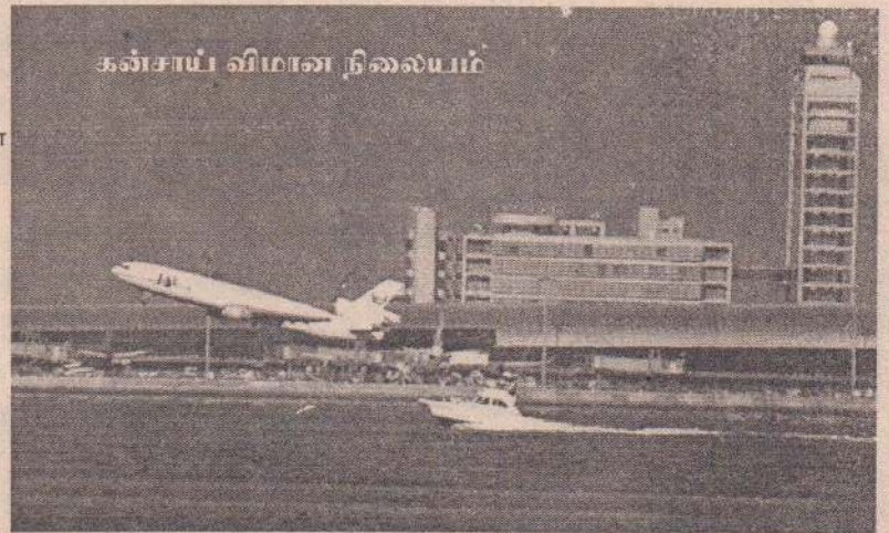
கன்சாய் விமான நிலையம்