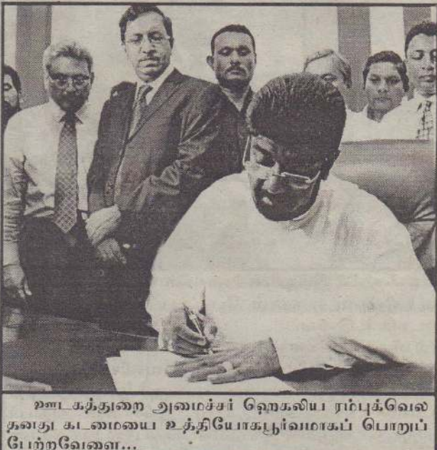
ஊடகத்துறை அமைச்சர் கெஹலிய ரம்புக்வேல தனது உரையை உத்தியோகபூர்வமாகப் பொறுப்பேற்றவேளை...