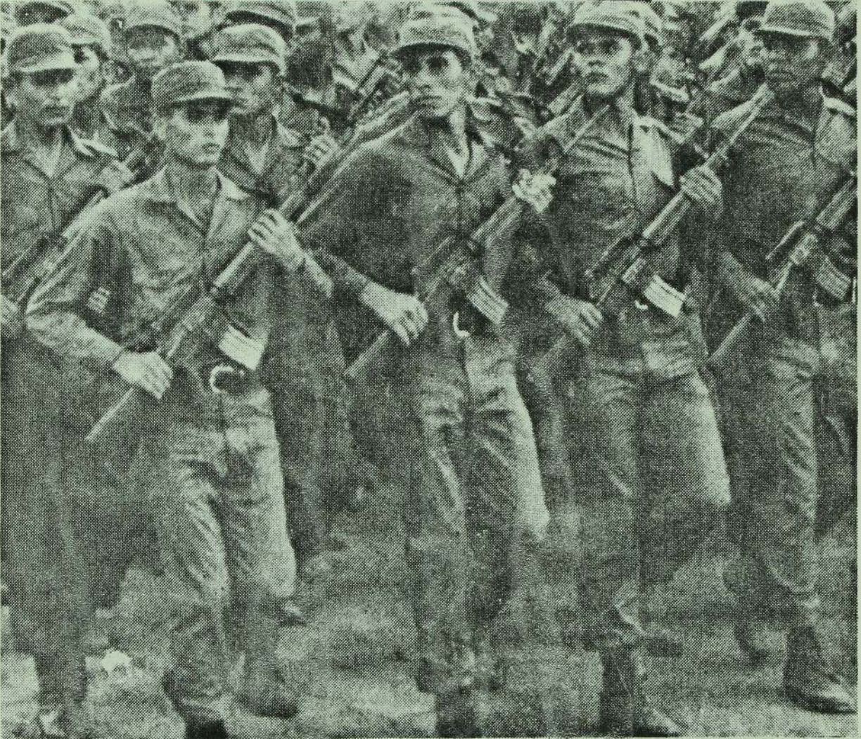
புரட்சியை பாதுகாக்க உயர்நாதி இரும் இல்லுலோலின் மக்கள் படை.

"நிக்கரகுவாவிலுள்ள அமெரிக்கப் படைகளின் பிரவேசத்தை நாம் நேரடியாக எதிர்கொள்வது நல்லது என்றே நான் எண்ணுகிறேன். ஏனெனில் அவர்களின் ஆக்கிரமிப்பை முறியடித்த பின்பு நாம் புரட்சியின் அடுத்த கட்டங்களை நிறைவேற்றும் தகுதிகளைப் பெற்றுவிடுவோம்."