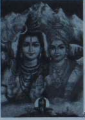
சிவம் இல்லையேல் சக்தியில்லை சக்தியில்லையேல் சிவமில்லை

என்னும் திருமந்திரத்தில் பெண்ணில் பெண் குணம் தான் சேர்ந்துள்ளது என்பது அறியாதவர்கள் கருத்து. பெண்ணில் ஆண்தன்மையும் உண்டு. உதாரணமாக பேணுதல் என்னும் செயற்பாட்டில் அன்பை வெளிப்படுத்துகையில் செயற்பாட்டு நிலையில் ஆண் பெண்ணாகும் நிலை உண்டு. அவ்வாறே காத்தல் என்னும் செயற்பாட்டில் வீரத்தை வெளிப்படுத்த வேண்டிய தேவை ஏற்படும் பொழுது செயற்பாட்டு நிலையில் பெண் ஆணாவதும் உண்டு. எனவே செயற்பாட்டு நிலையில் ஆண் என்கிற பாலியல் பேதங்கள் காட்டுதல் அறியாமையின் வெளிப்பாடு என இன்று Gender Equality என ஏதோ பாலியல் சமத்துவத்தை மேலைத்தேயமே கண்டு பிடித்தது போல் பேசுகின்றவர்களுக்கு திருமுல்ர் அன்றே தன் பாட்டால் பதில் சொல்வதைக் காண்கின்றோம்.