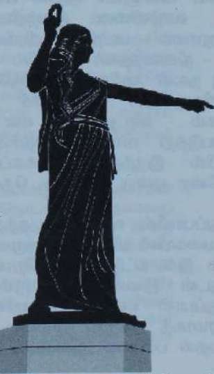
இளங்கோவின் கண்ணகியின் சிலை

இதனால் வள்ளுவர் வரலாற்றை மாற்றுகின்ற மனிதனை அவனது உள்ளத்தில் அவனது இல்லத்தில் அவனது நாட்டில் அவனது நாளாந்த வாழ்வில் இருந்து தோற்றுவிக்க முனைந்தார். இவை இவை தான் செய்யப்படல் வேண்டுமென்று தொகுத்து வகுத்து