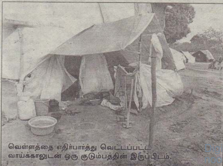
வெள்ளத்தை எதிர்பார்த்து வெட்டப்பட்ட வாங்காலுடன் ஒரு குடும்பத்தின் இருப்பிடம்.

இயந்திர கதியோடு நகர்ந்துகொண்டிருந்த கிளிநொச்சி நகரின் மையப்பகுதியில் மிகநீண்ட வரிசையில் வாடி வதங்கியபடி நூற்றுக்கணக்கான மக்கள் கண்களில் ஏக்கங்களோடு நின்றிருந்தனர். ஒரு சில தாய்மார்களின் கைகளில் கைக்குழந்தைகள் வேறு. அவை நீண்ட நேரமாக தாயின் கைகளிலேயே இருந்தமையால் சினங்கொண்டு எவ்வித சமரசங்களுக்கும் இடங்கொடாமல் வீரிட்டு அழுவதிலேயே கவனமாக இருந்தன. ஏதோ நிவாரணத்தைப் பெறுவதற்காக நின்ற கூட்டமென்று நினைத்துக்கொண்டு