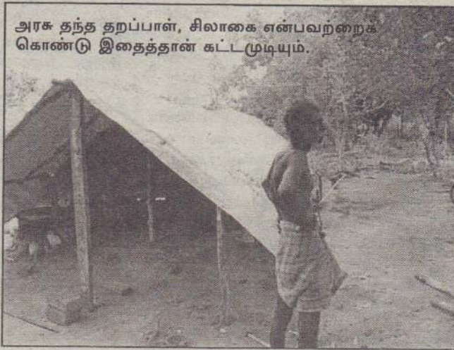
அரசு தந்த தற்பாள், சிலாகை என்பவற்றைக் கொண்டு இதைத்தான் கட்டமுடியும்.

ஓர் பெண் அதிகாரியிடம் “மழையால் மீள்குடியமர்ந்தோருக்கு ஏதும் பாதிப்பா?” என்று கேட்டதுதான் தாமதம், அந்த அதிகாரி இதற்காகவே காத்திருந்தது போல பொரிந்துள்ளத் தொடங்கினார். “உந்தச் சனங்கள் இப்படித்தான். ஏது குடுத்தாலும் அடங்காதுகள். அரசாங்கம் எல்லாத்தையும் செய்யமுடியுமே? அவைக்கு தற்பாளும் சிலாகைகளும் குடுத்திருக்கு. அதை வச்சுக்கொண்டு கொஞ்சம் மண்போட்டு மேடாக வீட்டைக் கட்டியிருந்தால் வெள்ளம் ஏன் போகப்போகுது? அரசாங்கத்தை மட்டும் நம்பாமல் சனங்களும் முயற்சிசெய்யவேண்டும். அதை விட்டுவிட்டு ஒழுக்கு, வெள்ளம் வருகுது என்று நெடுகச் சொல்லிக்கொண்டிருக்கிறதில் நியாயமில்லை” என்று மூச்சுவாங்கும் அளவுக்கு கூறி முடித்தார். ஆனாலும் பக்கத்தில் இருந்த இன்னோர் அதிகாரி அவரது கருத்தை உடனேயே மறுதலித்தார். “தற்பாள் காத்துக்கும் மழைக்கும் எப்பிடி நின்றுபிடிக்கும். சனங்களுக்கு கூரைத் தகடு குடுத்திருந்தால் தங்கட வீடுகளை அதுகள் ஒழுங்காகக் கட்டியிருக்கிறார்கள். தற்பாள் வைச்ச