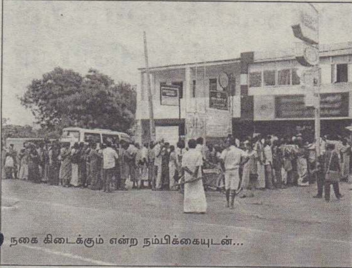
நகை கிடைக்கும் என்ற நம்பிக்கையுடன்...

கிளிநொச்சி நகரில் உள்ள வங்கியொன்றில் போர்நிகழ்வதற்கு முன்னர் நகைகளை அடகுவைத்தவர்களுக்கு நஷ்டஈடாக பணம் அல்லது அவர்களின் நகை என்பவற்றை வழங்குவதாகவும் அடகுவைத்த பற்றுச்சீட்டை கொண்டு வர வேண்டுமெனவும் அறிவிக்கப்பட்டிருந்தது. அதன்படி செவ்வாய்க்கிழமை - போயாநாளில் - மப்பும் மந்தாரமாக வானம் ‘இந்தா பார் மழையை அனுப்புகிறேன்’ என்று வெருட்டிக்கொண்டிருந்த சூழலிலும் அதிகாலை நான்கு முதலே குறித்த வங்கியை மக்கள் குழுத்தொடங்கினர். கிட்டத்தட்ட 600 பேர் மிகநீண்டவரிசை