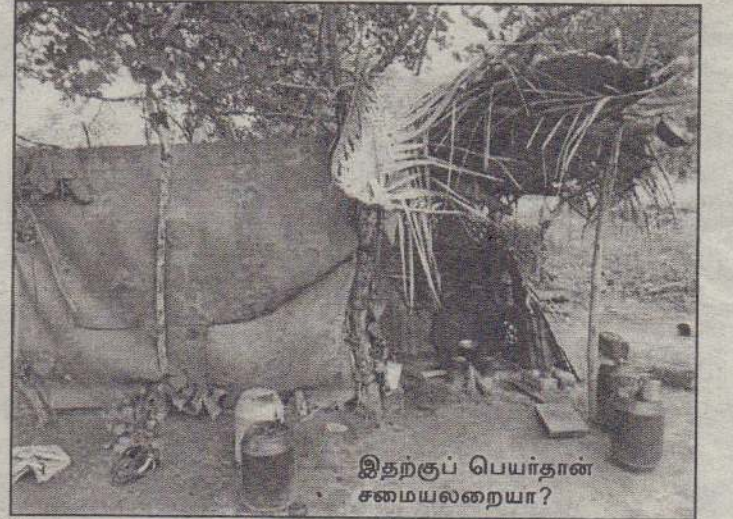
இதற்குப் பெயர்தான் சமையலறையா?

வாழ்க்கையில் எந்தவிதமான துன்பங்களையெல்லாம் அனுபவிக்கக் கூடாதோ அவற்றையெல்லாம்