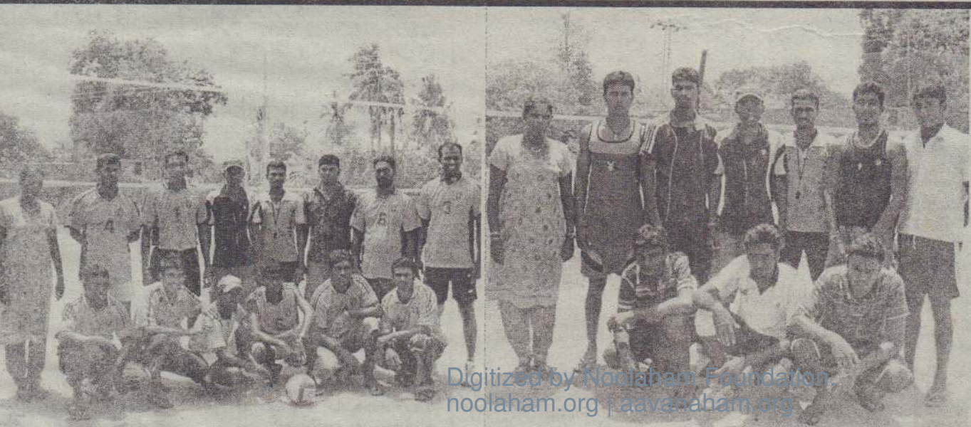
ஜனாதிபதி தங்கக் கிண்ணத்துக்கான பொது நிர்வாக உள்நாட்டு அமைச்சின் ஏற்பாட்டில் உடுவில் பிரதேச செயலாளர் பிரிவில் கிராம அலுவலர் பிரிவுகளுக்கு இடையே நடைபெற்ற ஆண்களுக்கான கரப்பந்தாட்டப் போட்டியில் சம்பியனாக தெரிவு செய்யப்பட்ட மல்லாகம் கோட்டைக்காடு ஸ்ரீ முருகன் விளையாட்டுக் கழக அணியை முதலாவது படத்திலும். 2 ஆம் இடத்தைப் பெற்ற உடுவில் மத்தி விளையாட்டுக் கழக அணி வீரர்களை இரண்டாவது படத்திலும் காணலாம். (படங்கள்: நேசன்)