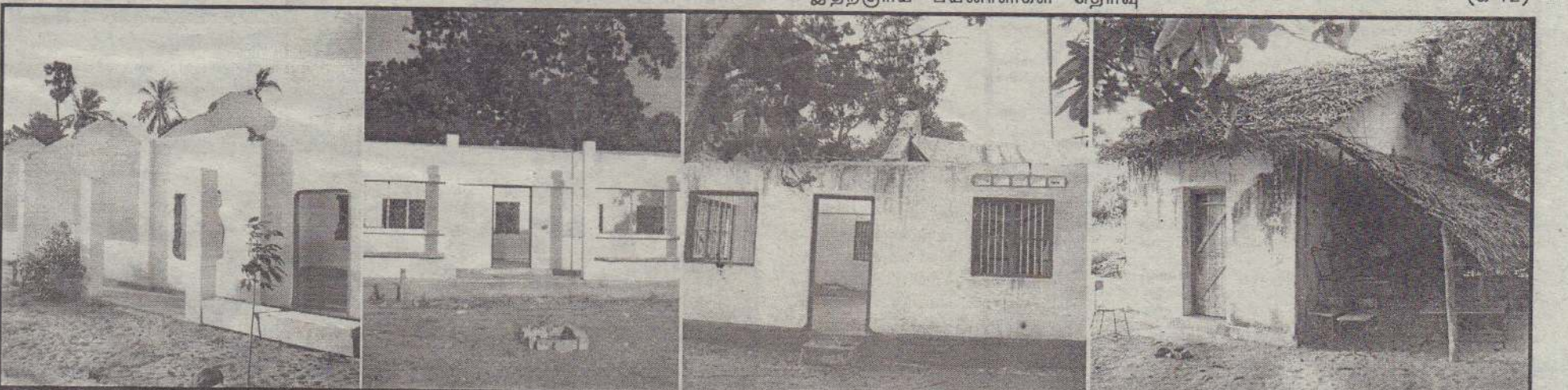
கிளிநொச்சி மாவட்டத்தின் பளை கல்விக் கோட்டத்திற்குட்பட்ட மாசார் அ.த.க.பாடசாலையின் கூரைகளற்ற கட்டடங்களை முதல் மூன்று படங்களிலும், கிடுகினால் வேயப்பட்டு அனுமதிக்கப்பட்ட இறுதிப்படத்திலும் காணலாம்.