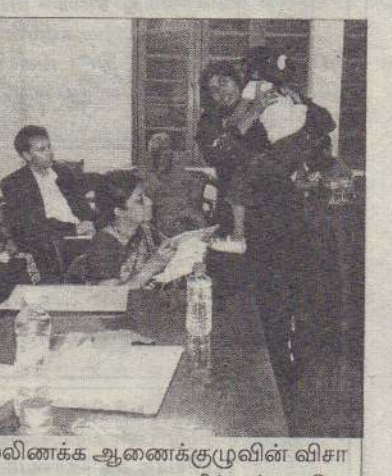
நல்லிணக்க ஆணைக்குழுவின் விசாரணைகளை அவதானிக்கும் அமெரிக்கத் தூதரக அதிகாரிகள்.

யாழ்ப்பாணம், நவ.16 வன்னியில் இடம்பெற்ற இறுதி யுத்தத்தின்போது ஷெல் வீச்சில் எனது கணவர் கொல்லப்பட்டார். எனது குடும்பத்தின் பொருளாதாரத்திற்கு அரசு உதவி செய்ய வேண்டும். இவ்வாறு கருணைமலர் ஆணைக்குழுவின் முன்னிலையில் சாட்சியம் அளிக்கையில் குறிப்பிட்டார். கற்றுக்கொண்ட பாடங்கள் மற்றும் நல்லிணக்க ஆணைக்குழுவின் அமர்வுகள் ஊர்காவற்றுறை சென். அன்றிஸ் தேவாலயத்தில் நேற்றுமுன்தினம் காலை இடம்பெற்றபோது அவர் இவ்வாறு சாட்சியமளித்தார். எனக்கு 3 பிள்ளைகள். எனது கணவர் எல்.ரீ.ஈ. உறுப்பினர் அல்லர். 2009 ஆம் ஆண்டு மார்ச் மாதம் 23ஆம் திகதி ஷெல் வீச்சில் அவர் கொல்லப்பட்டு விட்டார். தற்போது எந்த வித பொருளாதார உதவியும் இல்லை. எனவே அரசாங்கத்திடம் இருந்து உதவியைப் பெற்றுத் தாரங்கள் என்றார். உங்களது கோரிக்கையை எமது சிபாரிசில் உள்ளடக்கி ஜனாதிபதியிடம் கையளிப்போம் என்று ஆணைக்குழுவினர் தெரிவித்தனர்.