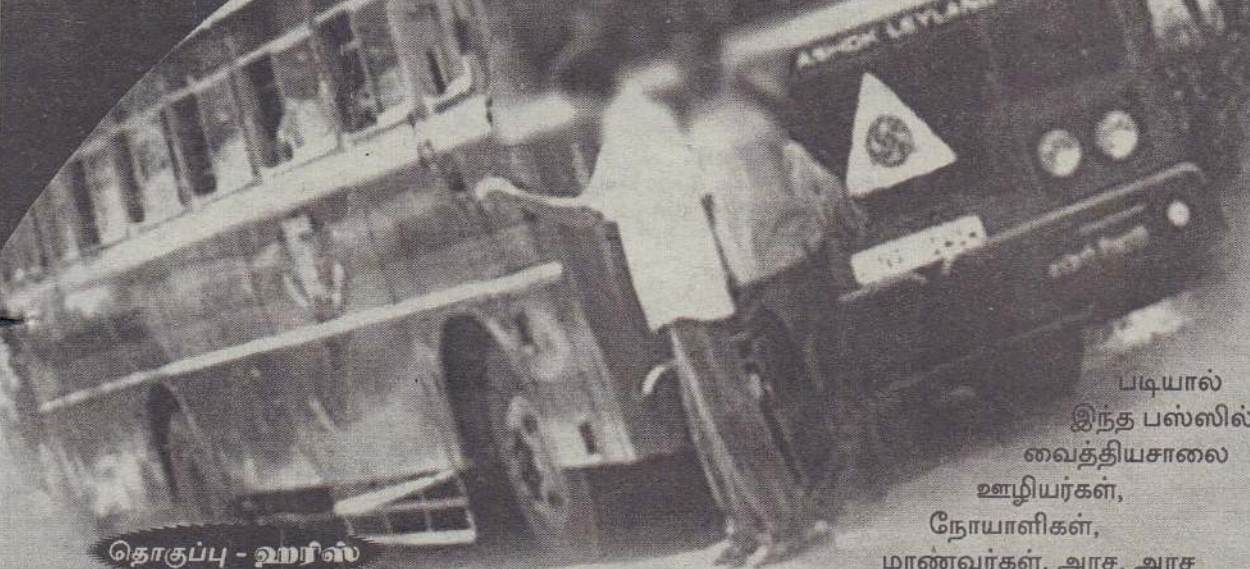
தொகுப்பு - ஹரிஸ்

பருத்தித்துறையில் இருந்து யாழ்ப்பாணம் நோக்கிச் செல்கின்ற 751ஆம் இலக்க பஸ் சேவையில் பெரும்பாலும் ஒழுங்கற்ற தன்மையே நிலவுவதாகப் பொதுமக்கள் தரப்பில் தெரிவிக்கப்பட்டுள்ளது. பருத்தித்துறையில் இருந்து காலை 6 மணிக்குக் கடற்கரை வீதி வழியாக பயணத்தை மேற்கொள்ளும் இலங்கைப் போக்குவரத்துச் சபைக்குச் சொந்தமான பஸ் பயணத்திலேயே இந்த ஒழுங்கற்ற நிலை நிலவுவதாகப் பொதுமக்கள் தரப்பிலிருந்து புகார்கள் வந்தபடியுள்ளன.