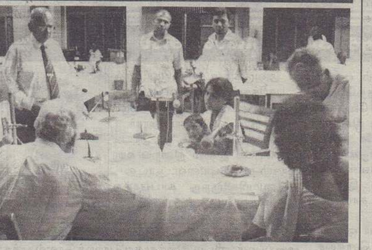
வாக்குமூலம்: சாவகச்சேரியில் சனியன்று நடைபெற்ற கற்றுக் கொண்ட பாடங்கள் மற்றும் நல்லிணக்க ஆணைக்குழுவின் அமர்வின்போது சாட்சியமளிக்கும் பெண்மணி. (131)