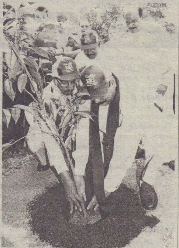
ஜனாதிபதி மஹிந்த ராஜபக்ஷவின் இரண்டாவது பதவிக் கால பதவியேற்பு நிகழ்வையொட்டி பதினொரு நிமிடங்களில் பதினொரு லட்சம் மரக்கன்றுகள் நேற்று நாடு முழுவதும் நடப்பட்டன. அலரி மாளிகையில் நேற்றுக்காலை 10.00 மணிக்கு ஜனாதிபதி வெண்சந்தமண மரக்கன்று ஒன்றை நட்டு இத்திட்டத்தை ஆரம்பித்து வைத்தார்.