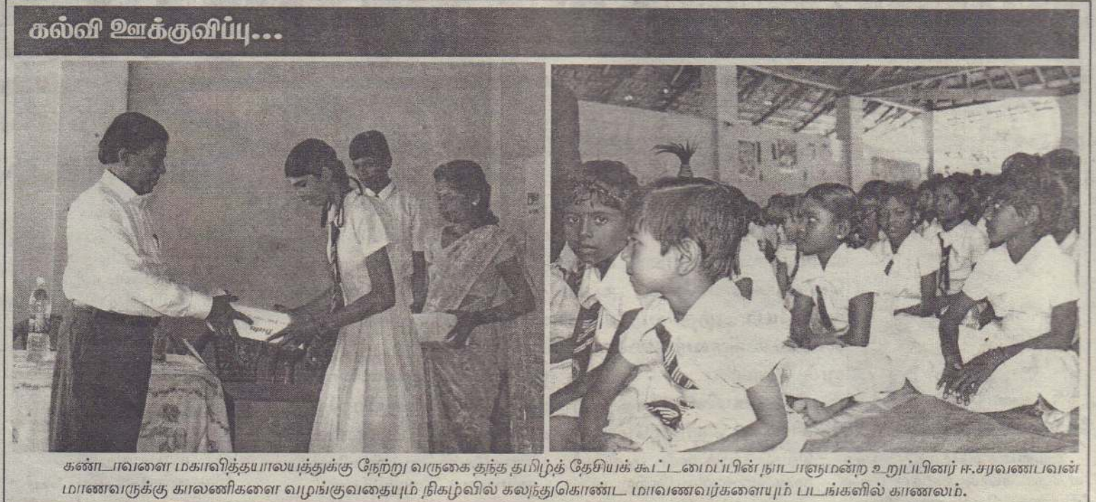
கண்டாவளை மகாவித்தயாலயத்துக்கு நேற்று வருகை தந்த தமிழ்த் தேசியக் கூட்டமைப்பின் நாடாளுமன்ற உறுப்பினர் ஈ.சரவணபவன் மாணவருக்கு காலணிகளை வழங்குவதையும் நிகழ்வில் கலந்துகொண்ட மாணவர்களுக்கும் படங்களில் காணலாம்.

மக்கள் விடுதலை முன்னணியின் நாடாளுமன்ற உறுப்பினர் சுனில் ஹந்துன் நெத்தியும் குழுவினரும் தாக்கப்பட்டமையானது தமிழ்த் தேசிய விடுதலை முன்னணியின் அரசியல் செயற்பாட்டுக்கு விடுத்த ஓர் அச்சுறுத்தலாகும். இவ்வாறான செயற்பாடுகள் மூலம் எமது கட்சியின் அரசியல் செயற்பாட்டைத் தடுக்க முனைகிறார்கள். - என்றார். (ஒ-சு)