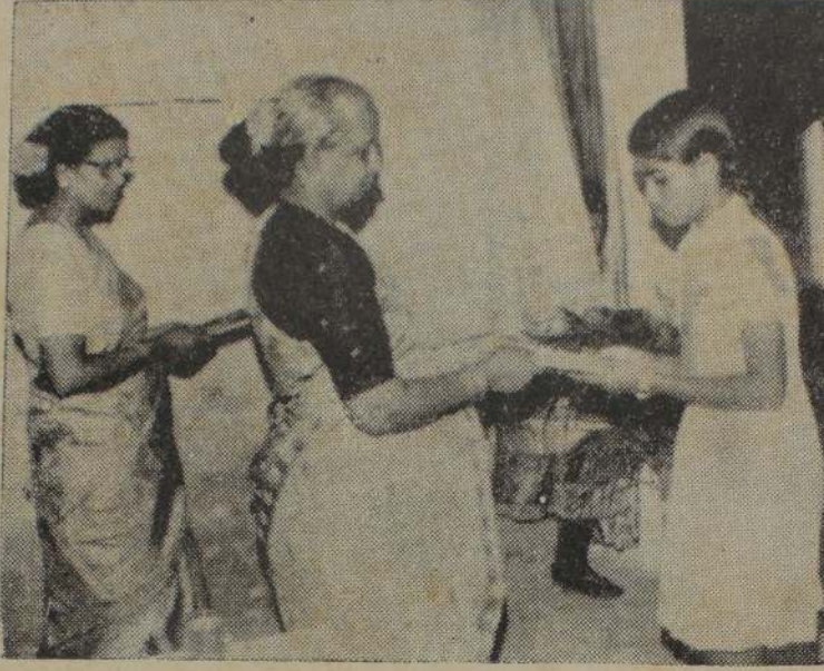
திருமதி தி. மாணிக்கவாசகர் பரிசுகளை வழங்குகிறார்