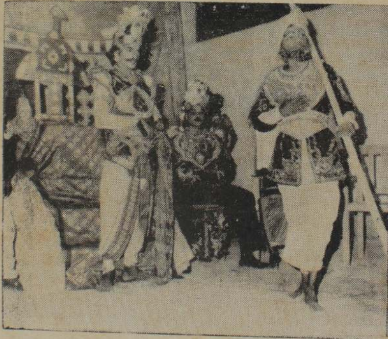
கலைவிழாவில் நடைபெற்ற வில் முறித்த விதுரன் நாடகத்தில் ஒரு காட்சி