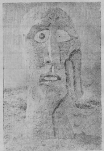
ஹிரோஷிமாவில் அணுகுண்டு வீசிவிடப்பட்ட பின்னர் எடுக்கப்பட்ட ஓவியம்

ஆகத்தொழில் மயப்பட்ட இப்பகுதியில் தொழிலாளர்களும், தொழிலாளர் உரிமையாளர்களும் ஏற்பட்ட பிரச்சினைகளைக் கடந்த ஆண்டு இறுதிப் பகுதியில் குறுது பதத்தில் நிலவி வந்தது. இந்த முறுகலான சூழலில், கடந்த புதுமுகத்தினத்தன்று, 'ஜன் நாடகம்'