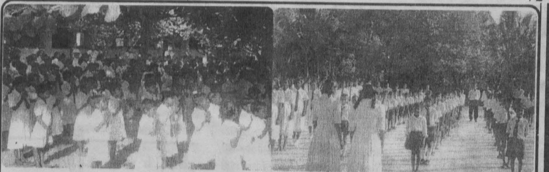
பாடசாலை மாணவர்களின் காலைப் பிரார்த்தனை

புவர் என புலமைப்பரிசில் சித்தி பெற்று வருகின்றனர். க.பொ.த. (சா-த) பரீட்சைகளிலும் சகல துறைகளிலும் மாணவர்கள் தெரிவாகிக் கொண்டு செல்கின்றனர். அண்மையில் 2000ம் ஆண்டில் நடந்தேறிய க.பொ.த.(சா-த) பரீட்சையில் 30 மாணவர்கள் உயர்தரம் படிப்பதற்குத் தெரிவாகியுள்ளனர். அதே போன்று க.பொ.த. (உ-த) ஆரம்பமாணமுதல் வருடமே ஒருவர் பல் கலைக்கழகத்துக்கும், கணிசமானவர் கல்விக்கல்லூரிக்கும் தெரிவாகிச் சென்றமை குறிப்பிடத்தக்கதாகும். தற்போதைய அதிபரின் விடாமுயற்சியால் 06-06-1999இல் பாடசாலையின்