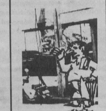
அவரு போட்ட பிரார்த்தனை அவருக்கே நாசமா போயித்து போல.....

அமைச்சர் ரவுப் ஹக்கீம் அமைச்சர் பதவியில் இருந்து ஜனாதிபதி நீக்கியுள்ளார் -செய்தி-