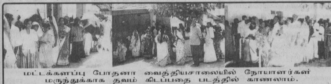
மட்டக்களப்பு போதனா வைத்தியசாலையில் நோயாளர்கள் மருந்துக்காக தவம் கிடப்பதை படத்தில் காணலாம்.

வரும் நோயாளர்கள் முதல் நாள் மாலை வந்து வைத்தியசாலையில் நின்று மறுநாள் வைத்திய சோதனையின் பின்னர் மருந்துக்கு நீண்டநேரம் காத்து நிற்க வேண்டியுள்ளதாகத் தெரிவித்துள்ளனர்.