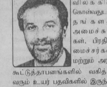
இதுவரை வழங்கி வந்த ஆதரவை விலக்கிக் கொள்வதன் தங்களை அமைச்சுக்கள், பிரதியமைச்சர்கள் மற்றும் அரசு