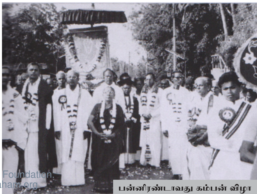
பன்னிரண்டாவது கம்பன் விழா