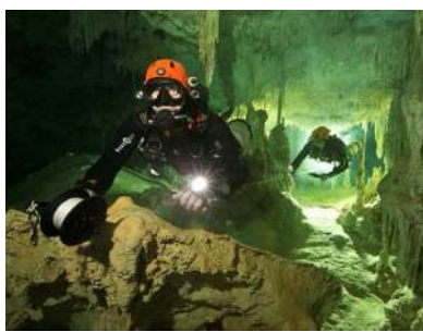
இது மிகவும் ஆச்சரியமான கண்டுபிடிப்பு என ஆராய்ச்சியாளர்கள் தெரிவிக்கின்றனர். (ப)

கிறது. இந்தக் குகை மாயன் இன மக்கள் பயன்படுத்தியது எனத் தெரிகிறது. இதன்மூலம் 15ஆம் நூற்றாண்டிற்கு முன் அப்பகுதியில் வாழ்ந்த மக்களின் பாரம்பரியம், வழிபாட்டு முறை போன்றவற்றை அறியலாம். கிரான் அக்குபெரா மாயா என்ற ஆராய்ச்சியின் ஒரு பகுதியாக இந்த குகை கண்டுபிடிக்கப்பட்டுள்ளது. சக் அக்டன் என்ற அமைப்பு இந்தக் குகையைக் கண்டுபிடித்துள்ளது.