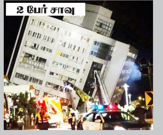
2 பேர் சாவு

நிலநடுக்கத்தால், ஹுவாலியன் நகரில் உள்ள 4 கட்டடங்கள் இடிந்து விழுந்தன. இடிபாடுகளில் சிக்கி 2 பேர் பலியானார்கள். மேலும் 114 பேர் படுகாயம் அடைந்துள்ளனர். தகவலறிந்து போரிடர் மீட்புப் பணியினர் மீட்புப் பணிகளில் ஈடுபட்டு வருகின்றனர். (பு)