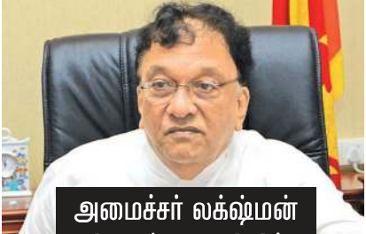
அமைச்சர் லக்ஷ்மன் கிரியெல்ல தெரிவிப்பு

கொழும்பு, பெப். 08 தொழில்நுட்பக் கல்வியைப் பெற்றுக் கொடுத்து அதிகளவிலான தொழில் வாய்ப்பைப் பெற்றுக் கொடுக்கும் நோக்கில் தொழில்நுட்பக் கல்லூரி ஒன்றை ஆரம்பிக்க எதிர் பார்த்துள்ளோம் என உயர் கல்வி மற்றும் நெடுஞ்சாலைகள் அமைச்சர் லக்ஷ்மன் கிரியெல்ல தெரிவித்துள்ளார். கண்டியில் இடம்பெற்ற நிகழ்வொன்றில் கலந்துகொண்டு கருத்துத் தெரிவிக்கும்போதே அவர் இவ்வாறு தெரிவித்துள்ளார். இதன்மூலம் இந்நாட்டின் இளைஞர் யுவதிகளின் வேலையில்லாப் பிரச்சினைக்குத் தீர்வைப் பெற்றுக்கொள்ள முடியும் எனவும் அவர் மேலும் தெரிவித்துள்ளமை குறிப்பிடத்தக்கது.