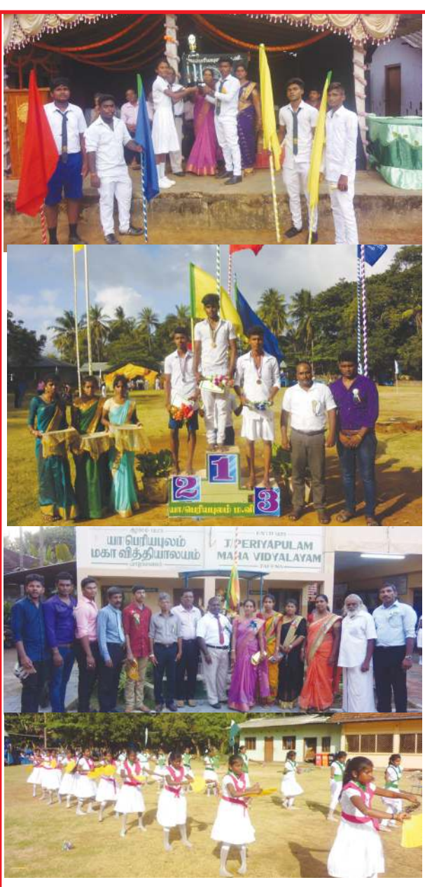
யாழ். பெரியபுலம் மகா வித்தியாலயத்தின் வருடாந்த இல்ல மெய்வன்மைப் போட்டி நேற்றுமுன்தினம் பாட சாலை மைதானத்தில் இடம்பெற்ற போது எடுக்கப்பட்ட படங்கள்.

இந்தப் பாதுகாப்பு நடவடிக்கைகள் தொடர்பில் 4178 பொலிஸ் விடே அதிரடிப்படையினர் உள்ளிட்ட 65,758 பொலிஸ் அதிகாரிகள், உத்தியோகத்தர்களைக் கொண்ட படையணி கடமையில் ஈடுபடுத்தப்படுவதாகவும், அவர்கள் நேற்று அந்தந்தப் பொலிஸ் அத்தியட்சகர் பிரிவுகளுக்குச் சென்று கடமைகளைப் பொறுப்பேற்று 9 ஆம் திகதி முதல் தேர்தல் கடமைகளில் குறிப்பிட்ட பகுதிகளில் பணியில் ஈடுபடுவர் என்றும் பொலிஸ் ஊடகப் பேச்சாளர் பொலிஸ் அத்தியட்சர் ருவன் குணசேகர தெரிவித்தார். (ஐ)