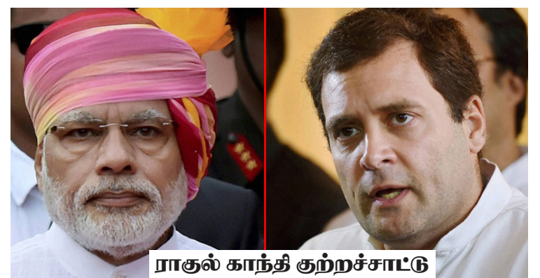
ராகுல் காந்தி குற்றச்சாட்டு

புதுடில்லி, பெப். 08 பிரான்ஸ் நாட்டிடம் இருந்து 36 ரபேல் போர் விமானங்களை வாங்க மத்திய அரசு ஒப்பந்தம் செய்தது. காங்கிரஸ் கூட்டணி ஆட்சிக்காலத்தில் பேசப்பட்ட விலையை விடத் தற்போது கூடுதல் விலை கொடுத்து வாங்கப்படுகின்றமையால் இதில் ஊழல் நடந்துள்ளது எனக் காங்கிரஸ் குற்றஞ்சாட்டியுள்ளது.