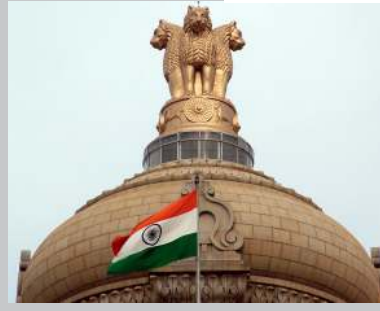
தவிர்க்க வேண்டும் என்று தெரிவிக்கப்பட்டுள்ளது.

இந்த நிலையில் மாலைத்வு நிலைமை தொடர்பாக மத்திய வெளியுறவுத்துறை அமைச்சகம் வெளியிட்டுள்ள அறிக்கையில், உயர் நீதிமன்றத் தலைமை நீதிபதி, அரசியல் தலைவர்கள் கைது செய்யப்பட்டமை கவலை அளிக்கின்றது. இந்த நிலையில், மாலைத்வுக்கு இந்தியர்கள் அத்தியாவசிய தேவையற்ற பயணங்களைத் தடுக்க வேண்டும் என்று தெரிவிக்கப்பட்டுள்ளது.