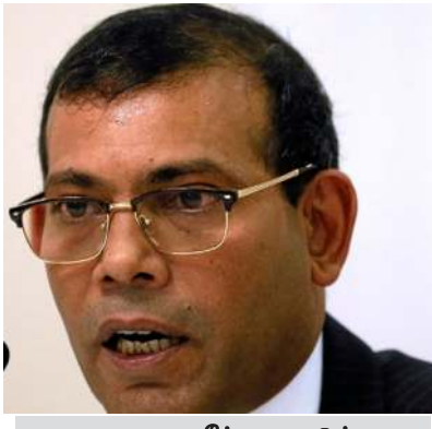
முகமது நவீத் கோரிக்கை

கொழும்பு, பெப். 08 இந்திய அரசு மாலைதீவுக்கு இராணுவத்தை அனுப்ப வேண்டும் என முன்னாள் அதிபர் முகமது நவீத் கோரிக்கை விடுத்துள்ளார். மாலைதீவில் அதிபர் அப்துல்லா யானின் அதிரடி நடவடிக்கையால் பெரும் அரசியல் குழப்பம் நீடிக்கின்றது. அங்கு நெருக்கடி நிலைப் பிரகடனம், அரசியல் கட்சியினர் மற்றும் நீதிபதிகள் கைது நடவடிக்கை நிலையை மோசமாகக் கருகிறது. போராட்டமும் தொடர்கிறது. சமூக வலைத்தளங்களிலும் எதிர்ப்புத் தெரிவிக்கப்பட்டு வருகிறது.