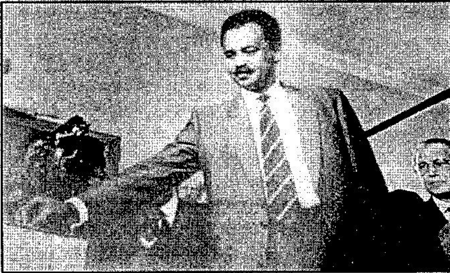
எரித்திரியா பிரிந்துசெல்ல வாக்களிக்கிறார் ஐசயாஸ் அப்வெர்கி

1991இல் தலைநகரான அஸ்மாரா வீழ்ந்தது. எரித்திரிய விடுதலைப்போராளிகள் நகரைக் கைப்பற்ற, அதுவரை எத்தியோப்பிய நுகத்தடியிலிருந்த அந்நகரமக்கள் வீதிகளில் இறங்கிகொண்டாடிய காட்சி நம் மெல்லிய மனப்பரப்பில் தேன்தடவுகிறது. இதே காலகட்டத்தில் எதிரியின் தேசத்தில் எரித்திரியா விடுதலை இயக்கத்தின் தோழர்கள் ஆட்சிக்கு வந்தனர் டெர்க் அரசின் தலைவரான மென்கிஸ்டு 1991ஆம் ஆண்டு எத்தியோப்பிய இயக்கங்கள் மற்றும் மக்கள் எழுச்சிக்கு அஞ்சி ஜிம்பாவேக்கு ஓடிப்போனார். அதைத்தொடர்ந்து டிக்ரெயன்