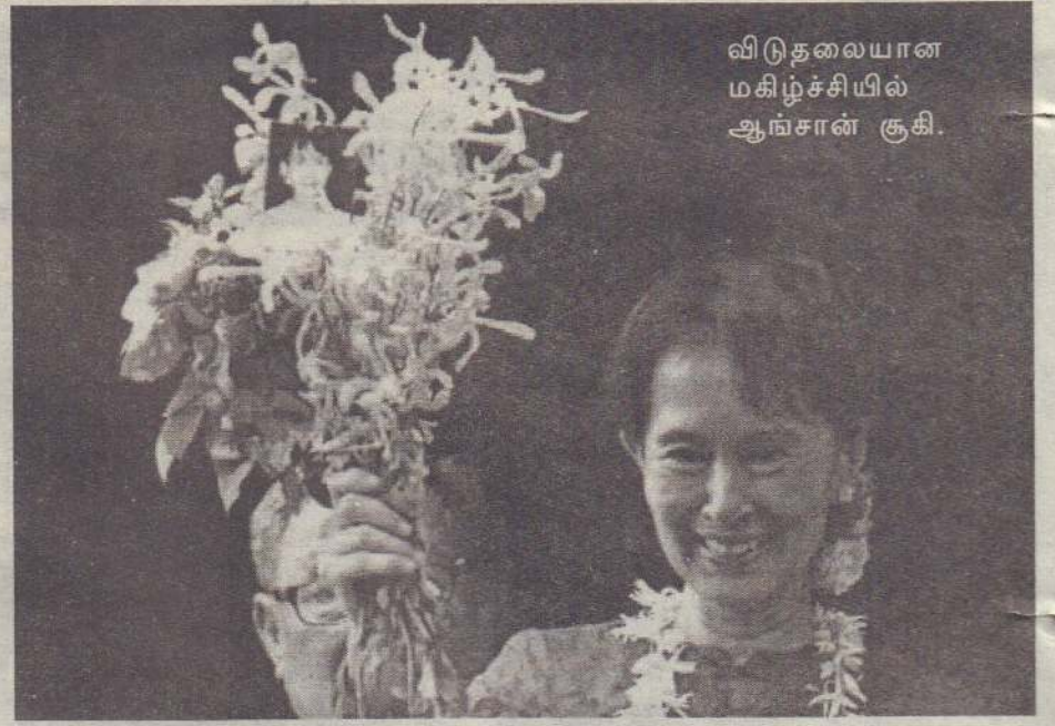
விடுதலையான மகிழ்ச்சியில் ஆங் சான் சூகி.

அதிகாரிகள் சூகியின் வீட்டுக்கு சென்று, அவரது விடுதலைக்கான உத்தரவை வாசித்துக் காண்பித்தனர். சூகியின் விடுதலையால் மகிழ்ச்சி வெள்ளத்தில் மூழ்கிய அவரது கட்சித் தொண்டர்கள், அவரது வீட்டு முன், பொலிஸாரால் போடப்பட்டிருந்த தடுப்புகளை உடைத்து முன்னேறினர்.