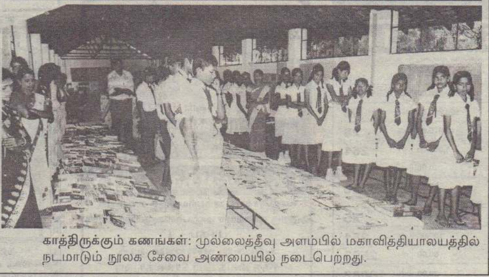
காத்திருக்கும் கணங்கள்: முல்லைத்தீவு அளம்பில் மகாவித்தியாலயத்தில் நடமாடும் நூலக சேவை அண்மையில் நடைபெற்றது.