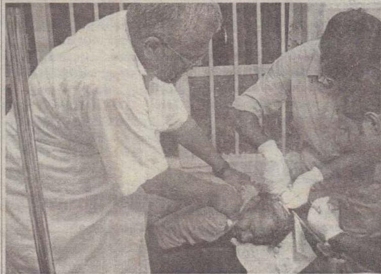
நேற்றைய தாக்குதலில் காயமடைந்த ஜே.வி.பி. உறுப்பினர்களுக்கு சிகிச்சை அளிக்கப்படும் போது அமைச்சர் டக்ளஸ் தேவானந்தா ஒத்தாசை புரிகிறார்.