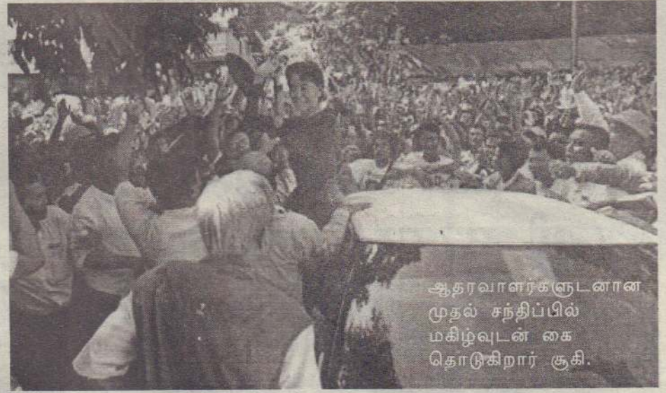
ஆதரவாளர்களுடனான முதல் சந்திப்பில் மகிழ்வுடன் கை தொடுகிறார் சூகி.

தன்னைப் பார்ப்பதற்காகக் கூடியிருந்த தொண்டர்களுக்கும் இதுவரை தனது விடுதலைக்காகப் போராடியவர்களுக்கும், சூகி தனது வாழ்த்துக்களையும், நன்றிகளையும் தெரிவித்துக் கொண்டார்.