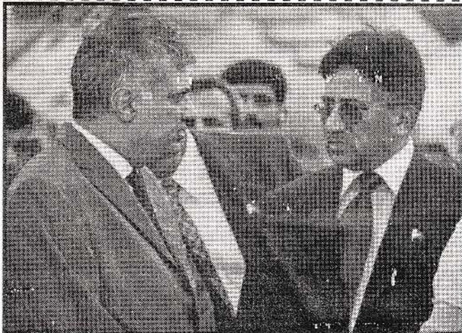
இலங்கைக்கு விஜயம் செய்த பாகிஸ்தான் ஜனாதிபதி முஷார்புடன் பிரதமர் ரணில் விக்கிரமசிங்க காணப்படுகிறார்.

தொடர்பான ஒரு பொடுபோக்குத் தன்மையினை காணக்கூடியதாக இருந்ததனால் இலங்கைத் தொடர்பாக நிதியத்தின் அங்கத்தவர்களிடையே ஒருவித கேள்விக் குறிகள் வெளிப்பட்டதாகவும் நிதியத்தின் முக்கியஸ்தர்கள் சுட்டிக்காட்டினர். ஆயினும், கடந்த ஆறு மாத காலத்தினுள் இலங்கையின் பொருளாதாரத்தில் தெளிவான வேறுபாடு ஒன்றினை ஏற்படுத்தியுள்ளதனால் செப்டம்பர் மாதம் நடைபெறும் சர்வதேச நாணய நிதிய மகாநாட்டு அங்கத்தவர்கள் கூட்டத்தின்போது இலங்கை சம்பந்தமாக பயனுள்ள முடிவகள் பல மேற்கொள்ளவிருப்பதாகவும் அவர்கள் சுட்டிக்காட்டினர்.