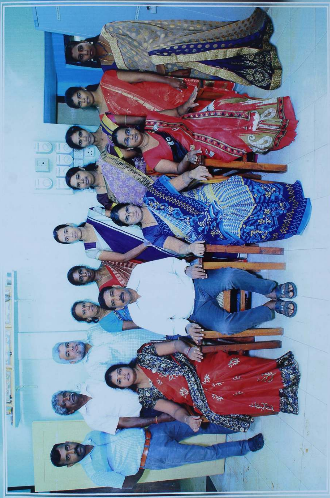
உத்தியோகத்தர்கள் வலி வடக்கு பிரதேச சயை உப அலுவலகம் மல்லாகம்