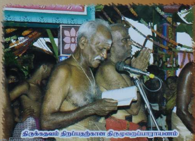
திருக்கதவம் திறப்பதற்கான திருமுறைப்பாடாபணம்