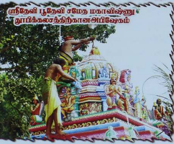
ஸ்ரீதேவி பூதேவி சமேத மகாவிஷ்ணு தூயிர்க்கலசத்திற்கான அபிஷேகம்