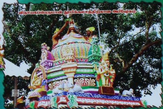
விநாயகப்பெருமான் தூயிக்கலசத்திற்கான அயிலேகம்