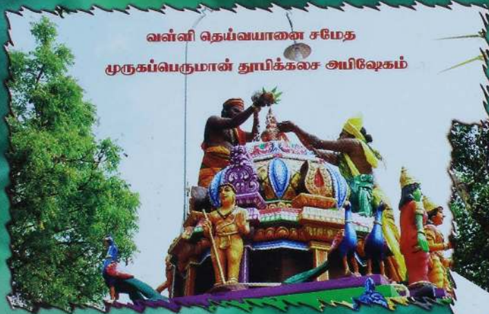
வள்ளி தெய்வயானை சமேத முருகப்பெருமான் தூயிக்கலச அயிலேகம்