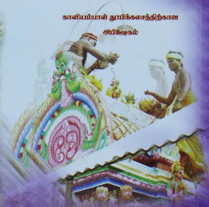
காளியம்பாளன் தூயிர்க்கலசத்திற்கான அபிஷேகம்