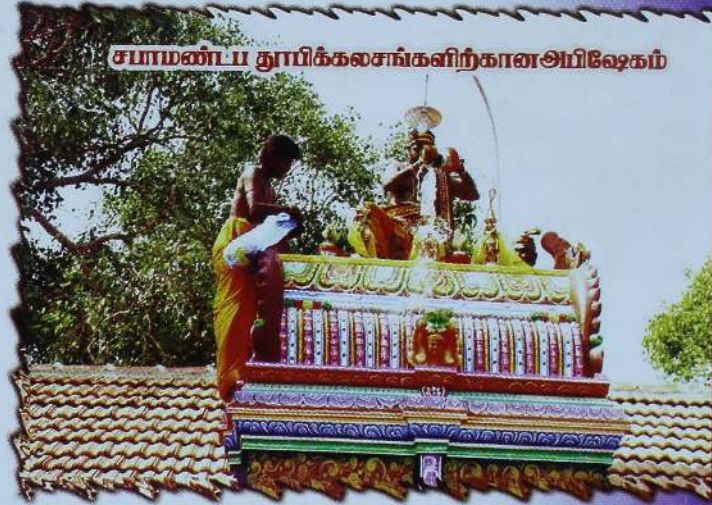
சமாமண்டப தூயிர்க்கலசங்களிற்கான அபிஷேகம்