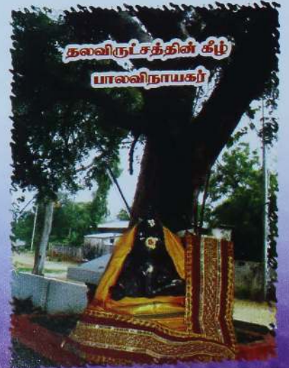
தலவிருட்சத்தின் கீழ் பாலவிநாயகர்