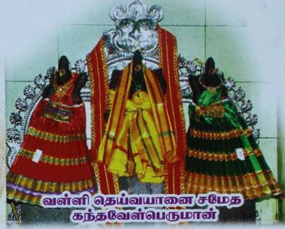
வள்ளி தெய்வயானை சமேத கந்தவேள்பெருமான்