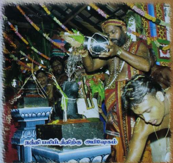
நந்தி பஸிபத்திற்கு அபிஷேகம்