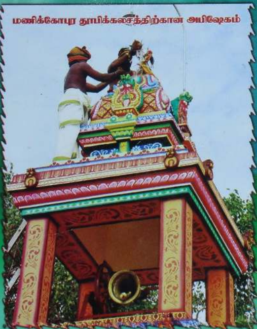
மணிக்கோபுர தூயிக்கலசத்திற்கான அயிலேகம்