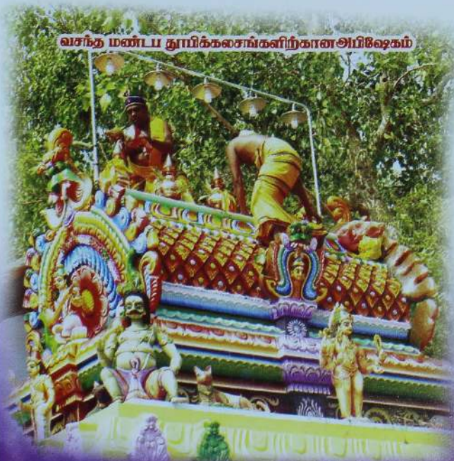
வசந்த மண்டப தூயிர்க்கலசங்களிற்கான அபிஷேகம்