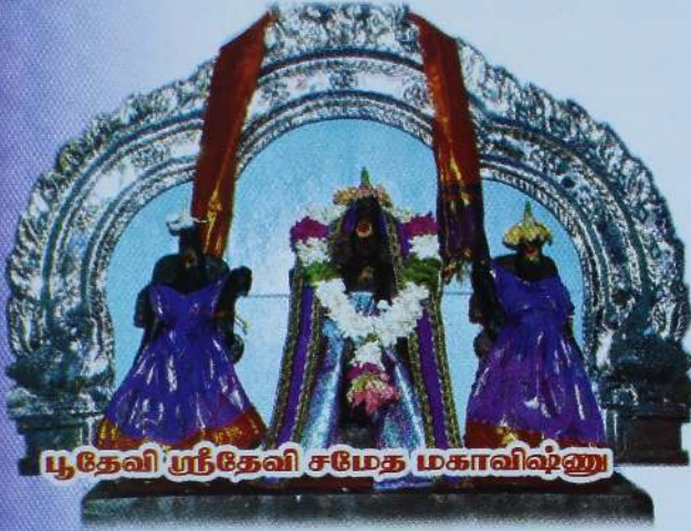
பூதேவி ஸ்ரீதேவி சமேத மகாவிஷ்ணு