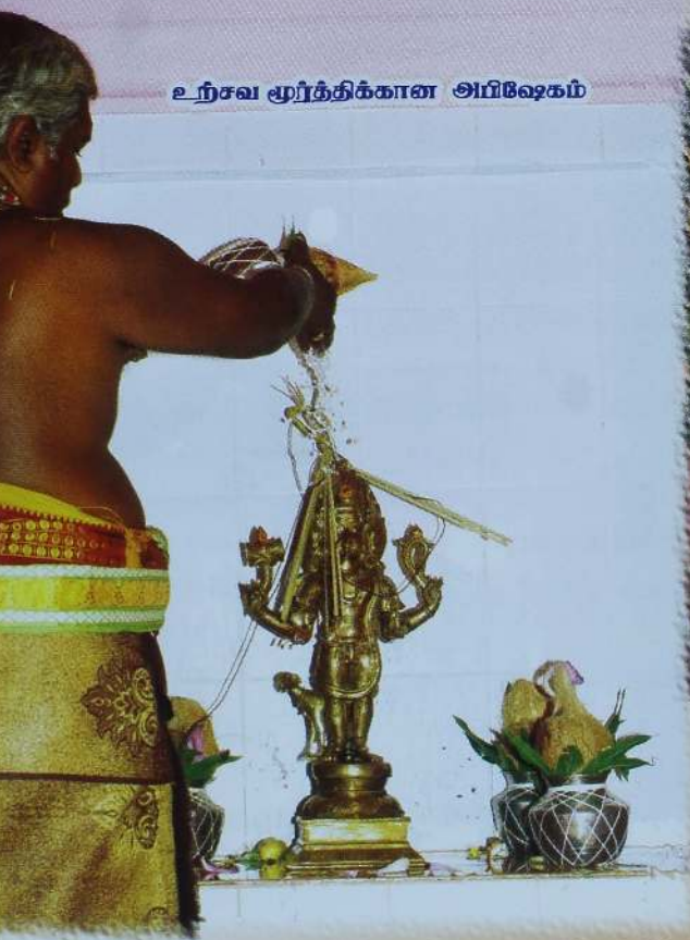
உற்சவ முர்த்திக்கான அபிஷேகம்