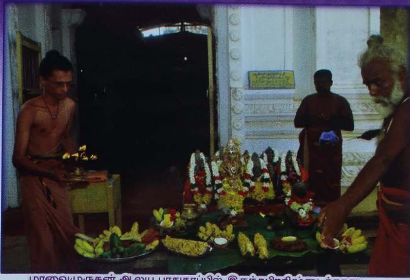
மாவைமுருகன் ஆலய பாதுகாப்பில் இருந்தபிரதிஷ்டைக்கான புதிய விக்கிரகங்கள் மாவை ஆதீனகர்தாவின் அருளாசியுடனும், தீபாராதனையுடனும் ஊர்வலமாக புறப்படுவதற்கான ஆயத்தம்