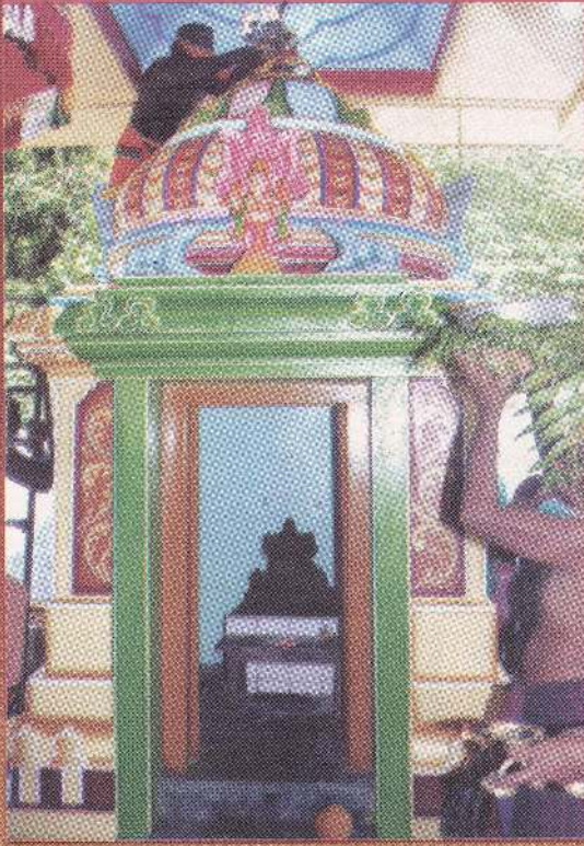
பிள்ளையார் கோயில் ஸ்தூபர்