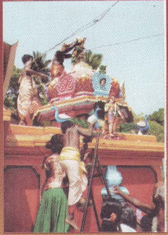
முருகன் கோயில் மூலஸ்தான ஸ்தூபர்