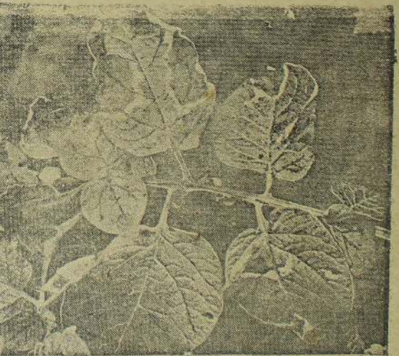
உருள்க்கிழங்கைத் தாக்கும் பைட்டோபாத்தா என்றும் இங்கே காளான் காளான் நோயை அன்றக்கோல் ஒழிக்கும்.

இலங்கையில் தயாரிப்போர் ஹெரெசும் விமிட்டெட் 50, போல்டர் ஓரூக்கை. கொழும்பு - 10.