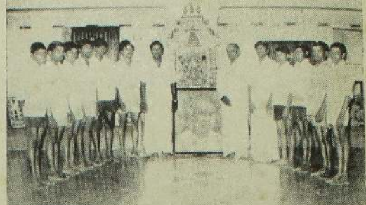
மட்டக்களப்பு கல்வி உப்போடை இராணுவத்தினர் இல்லத்து மாணவர்கள், வட்டாரதேச அபிவிருத்தி வேலைகளைப் பார்த்தறியவந்த நாட்களில் அவர்கள் ஆதரித்து வசதிகள் யாவும் செய்த மிக்கவை வர தொடர்பில் அதிபர், விருந்தாளிகளைத் தம்மனைவிக்கு வரவேற்ற காட்சியை மேலேயுள்ள படத்தில் காண்க.