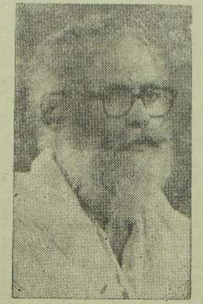
வித்துவமண மனுசித்திரம் பிள்ளை அவர்கள் நடமாடும் வாசலையே என்பார்கள். அக்காரை இங்கு பொன்னம்ப லப்பினை நடமாடும் சரிவ

திக - சம்பவாமாயணத்தை இரண்டுசொட்டை நூற்றைப யகில் வித்துவிரோமணிக் வித்துவிரோமணி அவர்களே இன்னையாவர்" என்றார்கள். அதன் இந்நிபாதிக்க மன