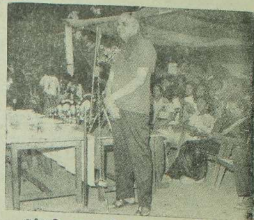
அரிவாள் சண்டையில் 31-ஆம் ஆண்டு நிதனவு விழாவில் 'ஆன்சோ' அமைச்சர் தலைமையில் அரசாங்கத்தின் பிரதமத்திரைக்கள் கலந்துகொண்டு உரையாற்றினார்கள்... இவ்வாறு இடம்பெற்ற மேல்வகுதிரை போட்டிகளில் வெற்றிபெற்றவர்களுக்கு திரைக்கள் அரசாங்கம் பரிசீலனை வழங்குகிறது.