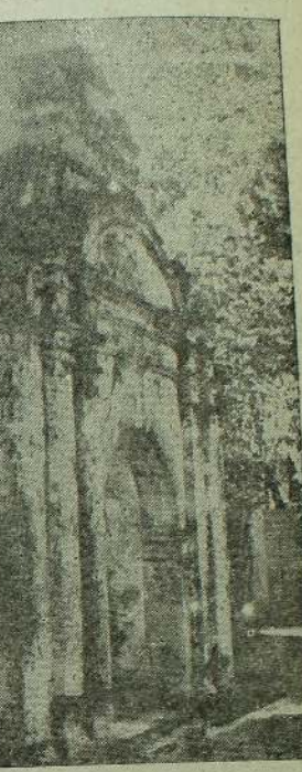
சங்கிலித்தோப்பின் வாயில் சிதைவுற்ற நிலையில் காணப்படுகிறது.

வீதியும், பருத்தித்துறை யாழ்ப்பாண விதியிரண்டும் சந்திக்கும் இடத்திலிருந்து ஏறத்தாழ சமமான தூரத்தில் கட்டப்பட்டுள்ளன. அதுமட்டுமின்றி இந்தத் தூரங்களானது ஏறத்தாழ, நல்லூர்க்கோட்டையின் கிழக்குமேற்கு, வடதெற்கு விதிகளின் சந்தியிலிருந்து சட்டநாதர், வெயிலுகந்தபிள்ளையார் ஆலயங்களின் தூரங்களுக்குச் சமமாகியிருப்பதைக் காணலாம். இவற்றிலிருந்து நாம் வரக்கூடிய முடிவு இதுதான். நல்லூர்க் கோட்டையானது கோட்டையின் மையத்திலிருந்து நான்குதிசைகளிலும் சமமான தூரங்களில் நான்கு வாசல்களிலும் வெளிப்புறமாக மேற்கூறிய நான்கு ஆலயங்களைக் கொண்டதாகவும் விளங்கியிருக்கவேண்டும். பின்னர் போர்த்துகேயர் ஆலயங்களை இடித்துவிடவே, முதலில் கட்டப்பட்ட சட்டநாதர் ஆலயம் பழைய இடத்திலும், புதிய நல்லூர் ஆலயம் கட்டப்பட்டபின் கட்டப்பட்ட வீரமாகாளியம்மன், கைலாசநாதர் ஆலயங்களை புதிய ஆலயத்தை மையமாக வைத்து புதிய இடங்களில் கட்டப்பட்டிருக்கவேண்டுமென்பதேயாகும்.