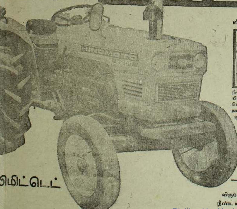
விசேட மிதப்புச் சக்கரங்கள்...