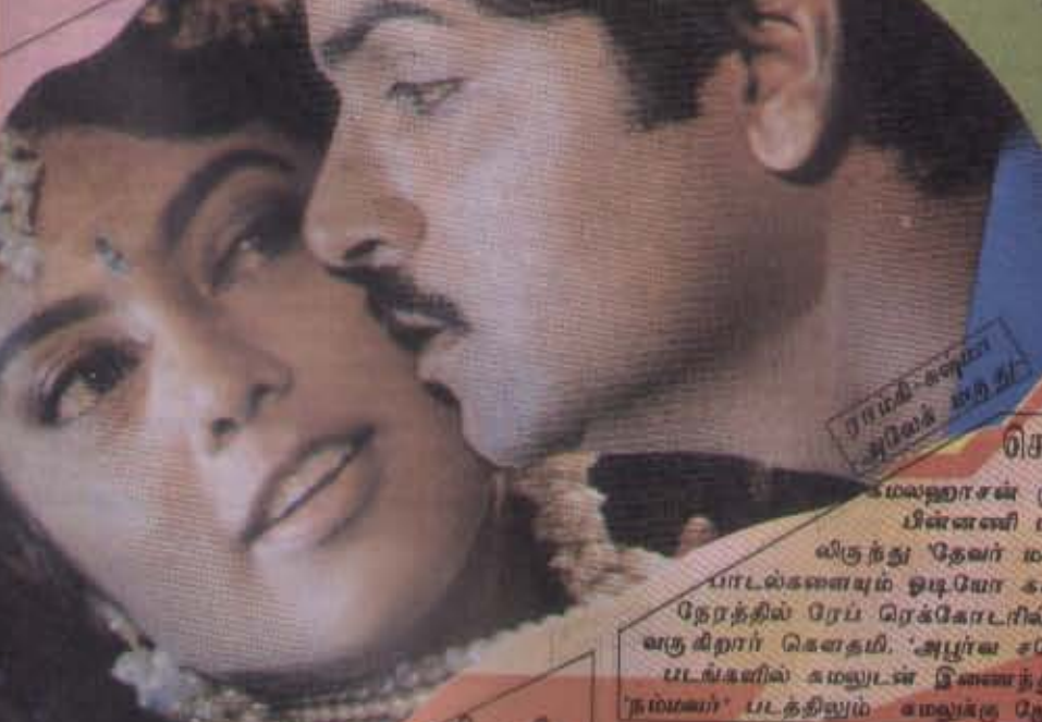
ராமகிருஷ்ண அலைக் கந்தி

பார்த்திபன் படம்-சரிசுமபதி ரோகினி படம்-தாண்டி