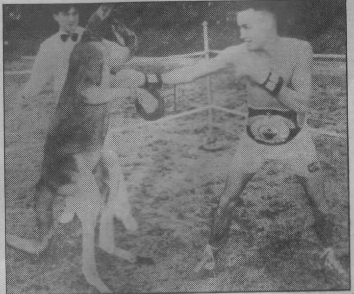
கங்காருவுக்கு மல்யுத்தப் பயிற்சி. எல்லாம் ஒரு மாற்றத்துக்குத்தான்.