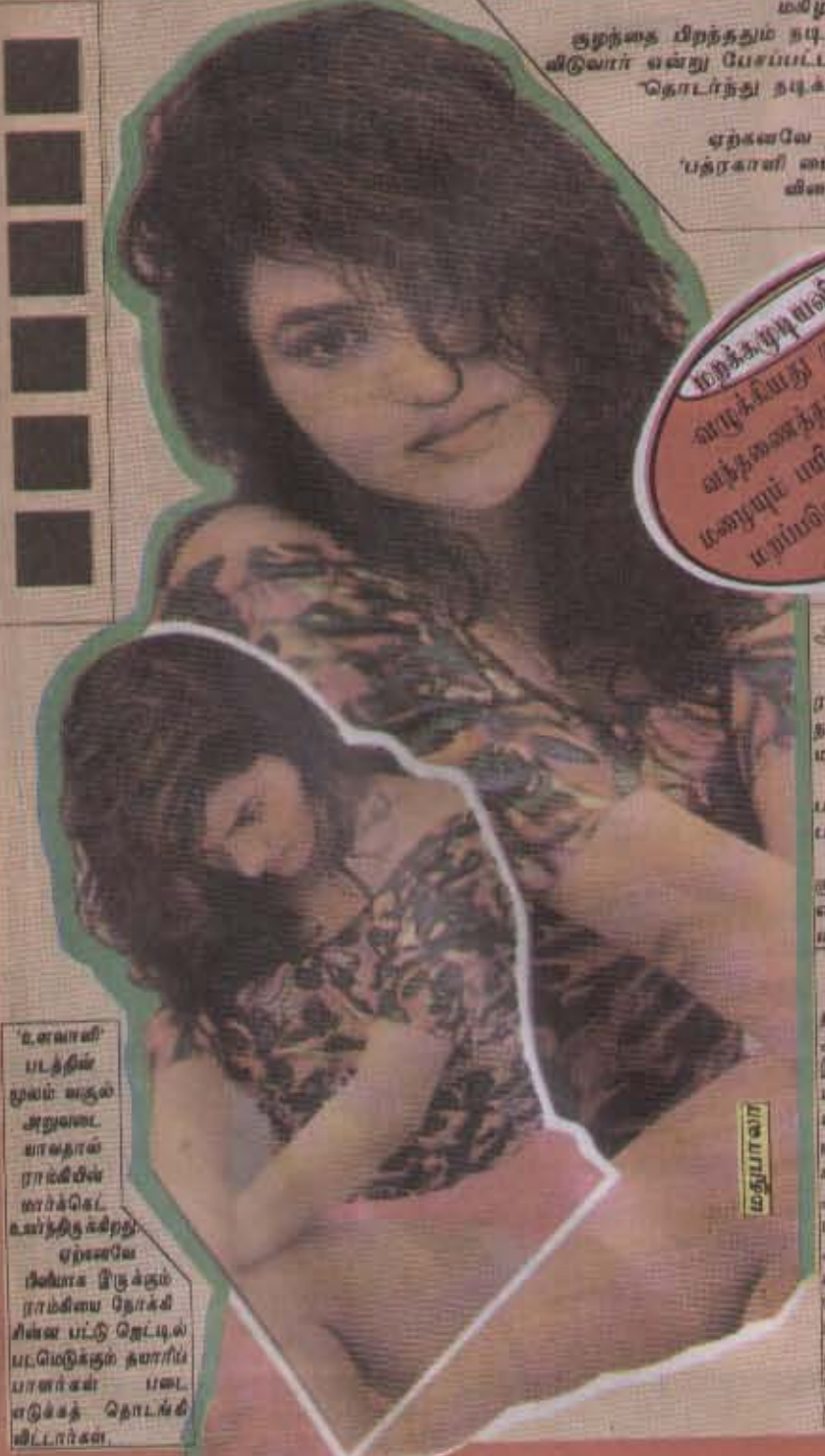
உளவாளி படத்தில் மூலம் கதா ஆளுவது யானதால் ராஜ்கிரிஸ் ஹாக்கெட் உயர்ந்திருக்கிறது. ஏற்கனவே சிலியை இருக்கும் ராஜ்கிரிஸ் நெக்சி சின்னம் பட்டு ஜெட்டிப் படமெடுக்கும் தயாரிப்பாளர்கள் படை எடுக்கத் தொடங்கி விட்டார்கள்.

அன்னை படத்தில் 1984 கொண்டாடல் வந்திருந்த சிரஞ்சீவி தந்த 'தமிழ்நாடு' பழமைய நாயகியில் சிவசுந்தரி நடித்தார். ஆர்யா நடித்த 'இவ்வாறு