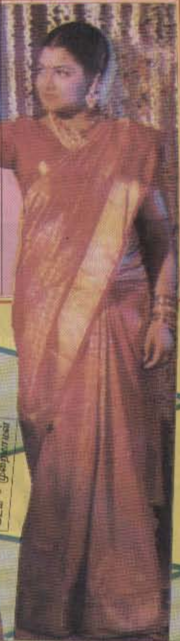
யடம் - முறைமான்

எம்.ஜி.ஆர். நடித்து வெற்றி பெற்ற படங்களில் பெயர்கள் மீது இன்றைய கதாநாயகர்களுக்கு பிரியம் ஏற்பட்டிருக்கிறது. அதில் ஒருவர் சரக்குமார். ஏற்கனவே 'நாடோடி மன்னன்' படத்தில் 'சரத்' என்று வகுக்கிறார். இப்போது புதிதாக சரத் 'சுயந்தமாயியுள்ள படம் 'ரகசிய பொலின்' 'ரகசிய பொலின் 115' என்னும் எம்.ஜி.ஆர். படம் பெயரில் 115 மட்டும் இதில் மிஸ்டர். எம்.ஜி.ஆர். படப் பெயர்கள் மீது மட்டுமல்ல அரசியல் மீதும் சரக்குமாருக்கு சினவதாய் ஒரு பிரியம் ஏற்படத் தொடங்கியிருப்பதாக திரையுலக வட்டாரம் முன்னுணுகிறது. 'நாடோடி மன்னன்' படத்தில் எம்.ஜி.ஆர். ஜெயலலிதா புகழ்பாடும் வாசகங்களை சரத் பேசியுள்ளார். படப்பிடிப்பை முடிவிலித்து வைத்ததும் ஜெயலலிதா தான்.