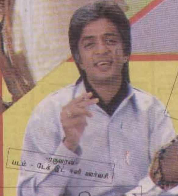
ரகுராவ் யடம் - ஜெக் டி. சலி ஷாவிசி