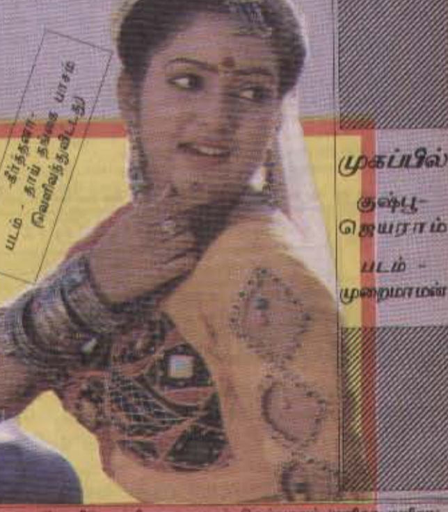
யடம் - சிரத்தலா - தாய் தங்கை பாசம் வெணவந்திவிட்டது