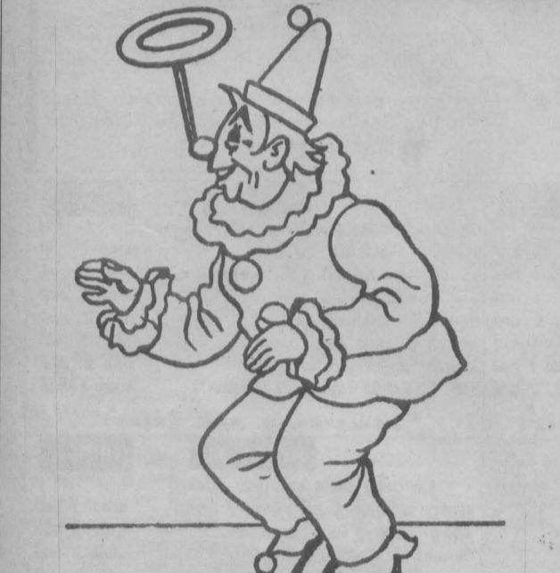
மேலே உள்ள படத்திற்கு வர்ணம் தீட்டி தபால்களில் ஒட்டி அனுப்புகள். சிறந்த வர்ணம் ஒன்றுக்கு பரிசு ரூபா 25/- காத்திருக்கிறது. அனுப்பவேண்டிய கடைசித் திகதி 20-05-1995.

வர்ணம் தீட்டும் போட்டி இல: 90 தினமுரசு வாரமலர் த.பெ.இல.1772 கொழும்பு.