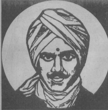
காற்றை யடைப்பது மனதாவே-இந்தக் காயத்தைக் காப்பது செய்கையே. சோற்றைப் பசிப்பது வாயாவே-உயிர் துணிவு வறுவது தாயாவே.