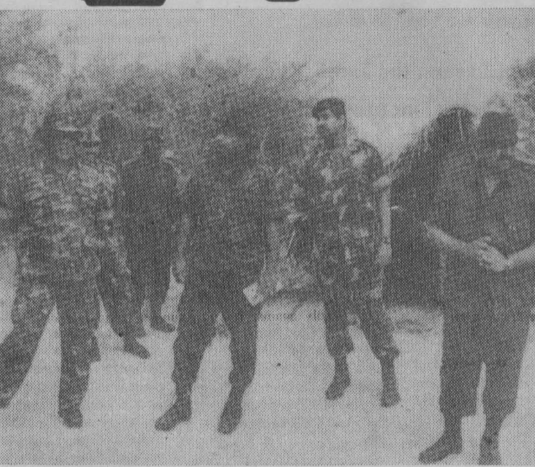
முற்றிலுமாக நிராகரித்து அப்போது வடக்கு-கிழக்கில் காணப்பட்ட மனிதாபிமானமற்ற குழந்தைகளைக்கெதிராக விஜயகுமாரதுங்க குரல் கொடுத்திருந்தார்.