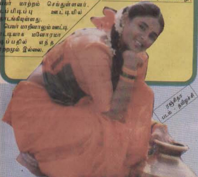
ரஞ்சிதா படம் - தமிழகம்

பிரபு - ககன்யா நடிகை 'ஊட்டி பாட்டி' என்ற பெயரில் உருவாகும் படம் பற்றி சென்றவார சினிசிட்டில் செய்தி வந்தது அல்லவா? அந்தப் பெயரை தற்போது மாற்றிவிட்டார்கள். 'மிஸ்டர் மெட்ராஸ்' என்று பெயர் மாற்றம் செய்துள்ளனர். படப் பிடிப்பு ஊட்டியில் தொடங்கியுள்ளது. பெயர் மாற்றமும் ஊட்டி பாட்டியாக மனோரமா நடிப்பதில் எந்த மாற்றமும் இல்லை.