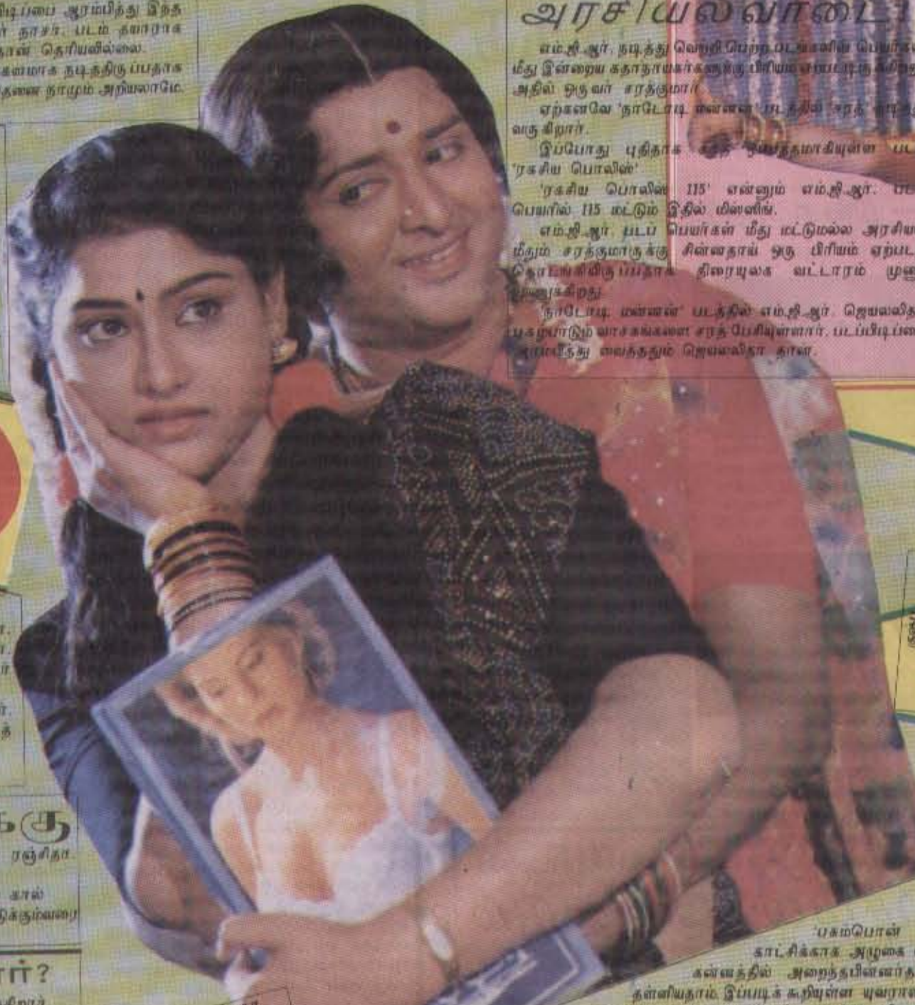
கதாநாயகி - சூல்தா (சிவபு சேனையோடு பெண்மேடத்தில் இருப்பவர்தான் கதாநாயகி) யடம் - ஸ்ரீ டி. பைட்டா