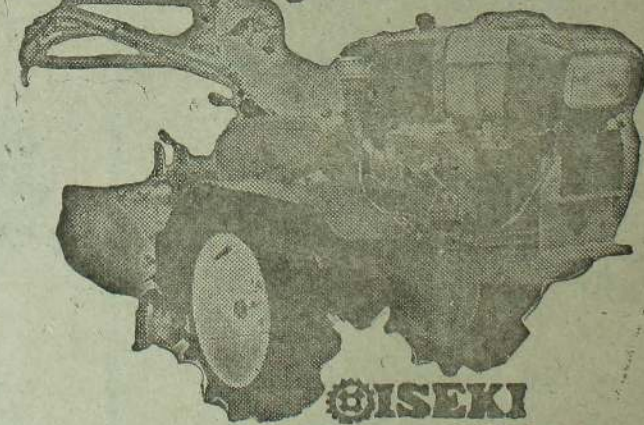
ISEKI Power Tiller

எதுவேண்டுமோ அத்தனையும் கிடைக்கிறது எம்மிடம்!! விவசாயிகளின் தேவைகளுக்கு:- நீரிறைக்கும் யந்திரம், இரண்டுசில்லு உழவு இயந்திரம், தெளிகருவிகள், உப உறுப்புக்கள், அலகத்தின் குழாய்கள், கிருமி நாசினிகள், விவசாய உபகரணங்கள், மின்காய், வெங்காயம், உருளைக்கிழங்கு போன்ற பயிர் செய்கைகளுக்கான உரக்கலவைகள்.