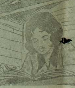
சாதனங்கள் நிறுத்தவை. இயக்க

காகப் போட்டியிட்டார். அப்பொழுது அவருக்கு 28 வயது. ஆறரை ஆதித்து பூர்வப் ஆறுமுகநாவலர் அவர்களின் தலமையில் பொதுக்கூட்டங்களும் நடைபெற்றுள்ளன. 1879 ஆகஸ்ட் 27ந் திகதி அச்சபையில் உறுப்பினராக நியமனம் பெற்றார். இயத்தியில் இருந்த காலத்தில் தநட்டுக்காக அவர் செய்த சேவைகள் அனந்தம். இதன் காரணமாகவே முன்னாள் இலங்கையின் பிரதமரும், தேசப் பிரதமராகிய அமரர் டி. எஸ். சேனநாயக்கா ஒருமுறை, ‘சேர் பொன். இராமநாதன்