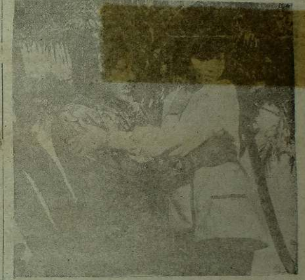
ஒரு புலிடம் பள்ளி வான சிக்கத தயக்கிறவார் அல்லது ஒரு வெள்ளை வேங்கையிடம் சிக்கித் துண்டு கிறதா? ஈழத்துப் பட்டாண 'ஒருதலை காதல்' திரைப் படத்தில் ஒரு காட்சி இது.