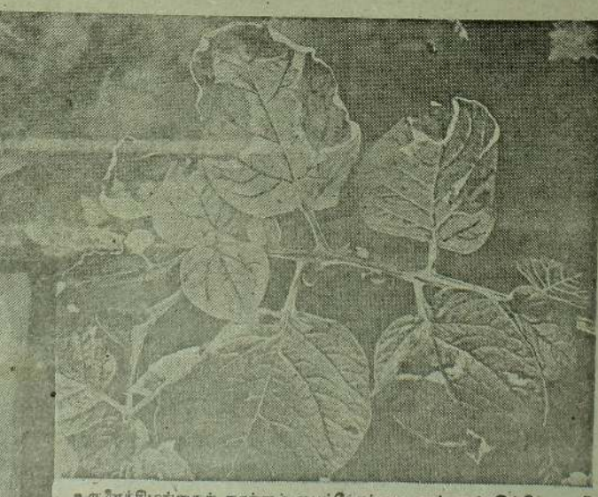
உருளைக்கிழங்கைத் தாக்கும் பைட்டோப்துரா என்னும் இங்கே காணும் காளான் நோயை அன்றக்கோல் ஒழிக்கும்.

பயிரை இளம் பருவத்திலும் முதிர் பருவத்திலும் தாக்கும் முள், மின் கூற்று வெளிநல் நோய் பற்றி உருளைக் கிழங்கு பயிரிடுவோர் இனி அஞ்சத் தேவையில்லை. அதற்கு வன்மை வாய்ந்த மருந்தான அன்றக்கோல் பங்கசுநாடுவியை உற்பத்தி செய்து தருகிறது "ப்ராயர்". காய்கறி, புன்கமில், திராட்சை, தோடை, பழ விருட்சங்கள், வாழை முதலாம் தாவரங்களைப் பாதிக்கும் காளான் நோய்களுக்கும் அன்றக்கோல் சிறந்தது. ஆரோக்கிய வளர்ச்சி, அதிக விளைச்சல், கூடுதல் லாபம் தருவது அன்றக்கோல்.