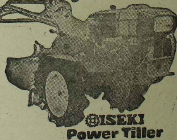
ISEKI Power Tiller

பாவனைப் பொருட்கள்: கோல்மன் பெற்றோமக்ஸ், கால்நடைகளுக்கு: உணவுத்தின் வகைகள், சகல மருந்துவகைகள் ப. நொ. கூ. சங்கங்களுக்கு சலுகை வசதியுண்டு வர்த்தக விசாரணைகள்: