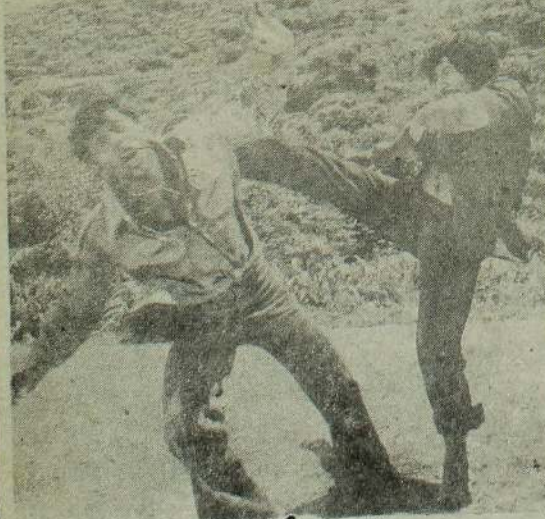
செயல் ஆடல் அளிக்கும்

ராணி தினசரி 10-30, 2-15, 6-00, 9-30 யாழ்ப்பாணம் 2-வது வாரம்